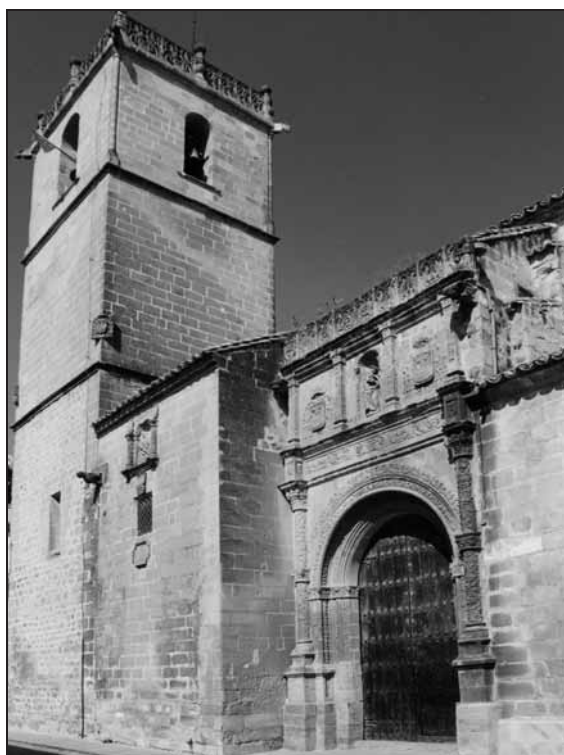
2. Parroquia de San Andrés Apóstol y Santa María del Alcázar Narváez Fotógrafo.