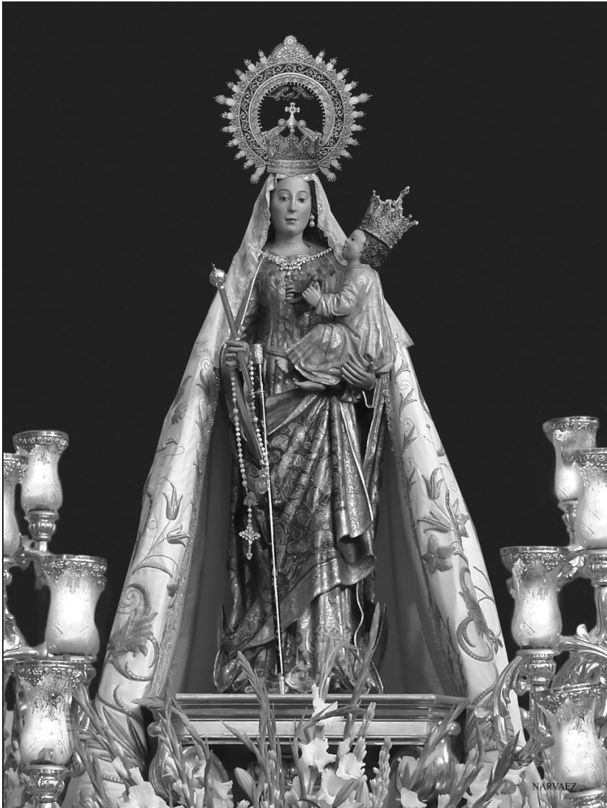
Santa María del Alcázar.