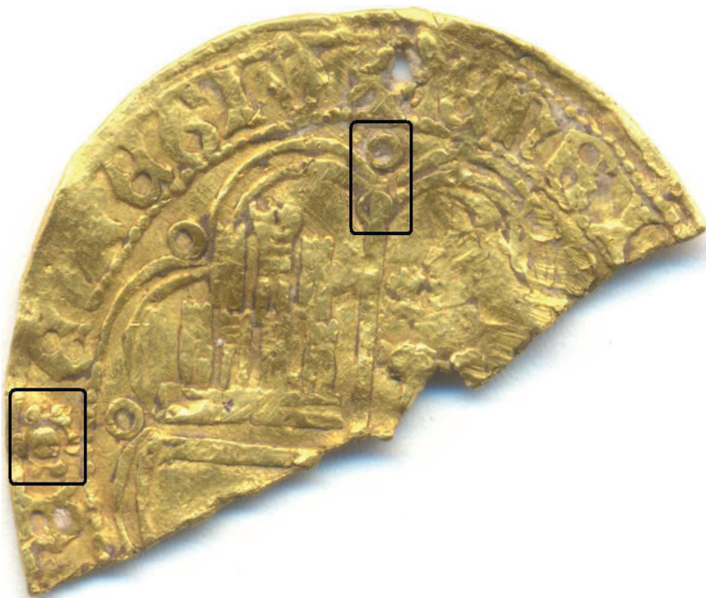
Figura 5. Detalle de la posición en el reverso de los roeles y el florón.