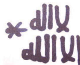
Lámina núm. 2