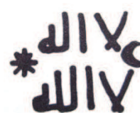
Lámina núm. 4