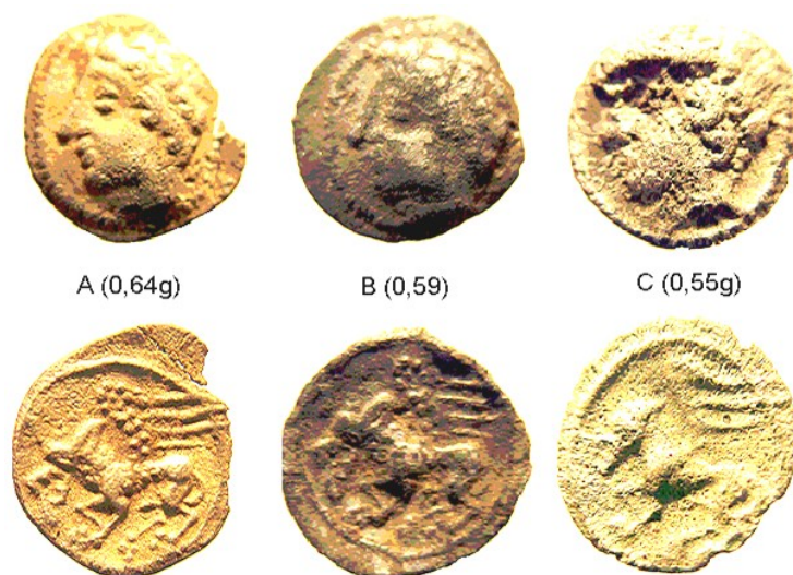
Figure 1 : Oboles attribuables aux Cadurques