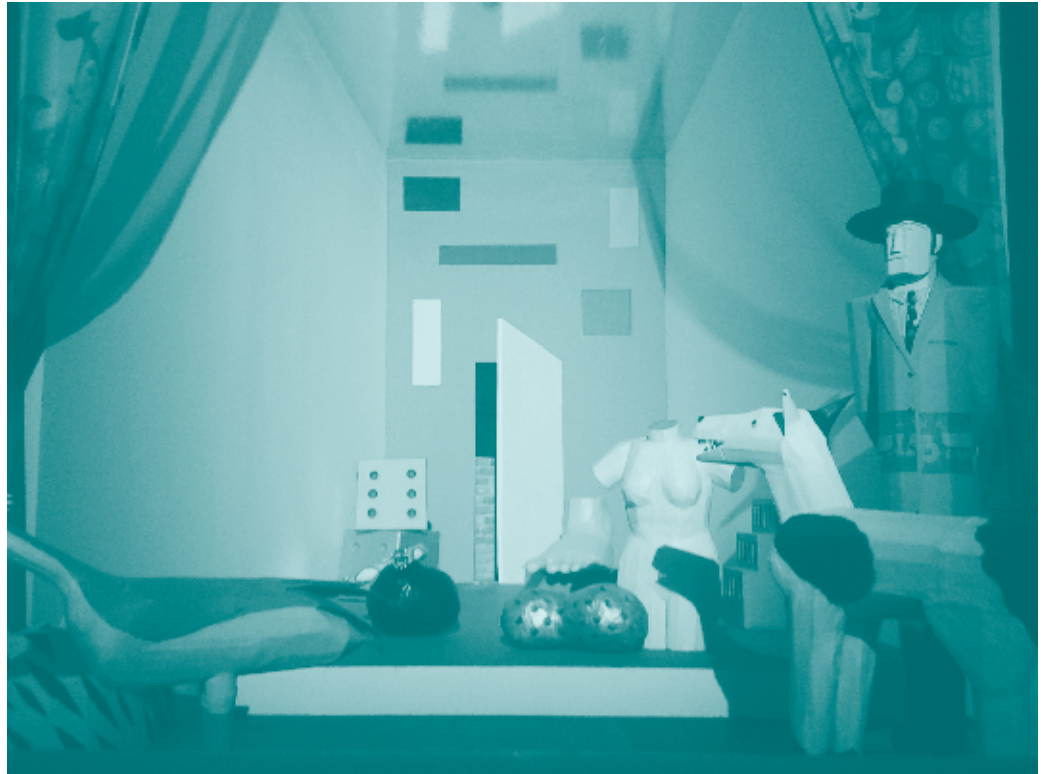
▲ 53 rd International Art Exhibition Making Worlds , Fotografía: usuario Flickr Stefano Meneghetti