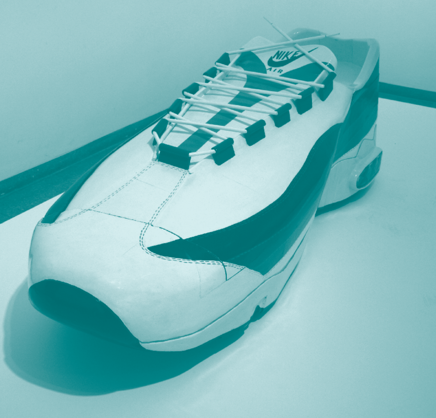
▲ "Coffin in the Form of a Nike Sneaker", madera y pigmentos, Paa Joe, 1990.