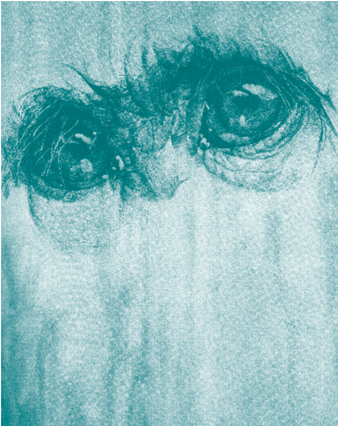
◀ Camilla Adami, "Primate", 2001, carboncillo sobre lienzo, 195 x 144 cms (Colección Matta)

bajo vientre, tal como demuestra el reporte que algún frequentador del Poemilla de Bogislao , redactado entre 1947 y 1957, enfrentará al "sueño Nadie-me-nombre, Nadie-me-mire-ni-de-soslayo", a no dudarlo el "que se lleva su varapalo" (De Greiff, 1957d: 263): " Fráncfort, finales de diciembre de 1959. Sueño de ejecución -Hinrichtungstraum. Decapitación. No estaba decidido si había que cortarme la cabeza o guillotinar me, pero, sin duda para tranquilizarme, la metí en una hendidura. El hierro me rozó el cuello en una desagradable prueba. Le rogué al verdugo que me ahorrra aquello y acabara de una vez. El golpe cayó sin que yo me despertara. Mi cabeza se encontraba ahora probablemente en una zanja, lo mismo que yo. Muy tenso -Mit großer Spannung-, intenté averiguar si seguía con vida o si el pensamiento desaparecía de la cabeza al cabo de un par de segundos. Pronto no cupo duda de que seguía existiendo. Observé que yo estaba allí sin cuerpo... además de sin cabeza. También parecía capaz de percepción. Para mi horror descubrí, en cambio, que se había cortado absolutamente toda posibilidad de mostrarme y de comunicarme como siempre. Pensé: el absurdo de la creencia en espíritus reside en que elimina este factor decisivo, lo que constituye el espíritu puro -den reinen Geist-, su absoluta invisibilidad[?], y es precisamente eso lo que lo delata a su vez al mundo de los sentidos.