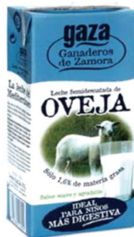
Ilustración 1. La leche de oveja es una opción para la desnutrición por ser más nutritiva y más digestiva.

Los anticuerpos policlonales anti-GMPb fueron reactivos al GMPo. Con estos anticuerpos se puede desarrollar un método de análisis para detectar adulteración con SQ en leche de oveja. Este método es más preciso y rápido que otros métodos que se han utilizado para detectar este tipo de adulteración.