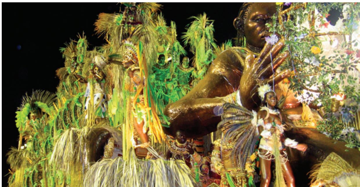
Carnavales Río de Janeiro

Como comentario final, cabe anotar que, si bien la identificación y clasificación de factores críticos de desempeño es importante para un sector económico emergente y en crecimiento, el alcance del proyecto no cubrió otros actores que deben considerarse para el fortalecimiento de este sector: instituciones de apoyo y formación