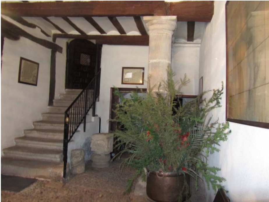
Portal del hospital de la Madre de Dios de Nájera.