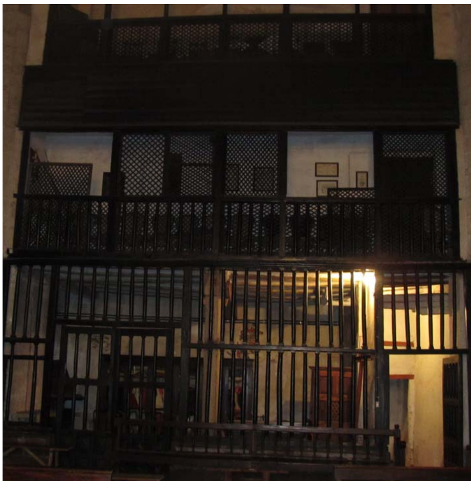
Interior de la iglesia Madre de Dios.