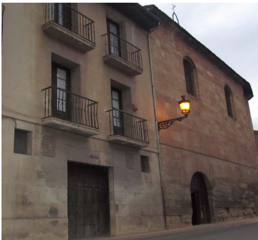
Iglesia y Hospital Madre de Dios en Nájera.

La iglesia Madre de Dios es un edificio que se encuentra situado en la calle San Fernando núm. 37 de la ciudad de Nájera. Estuvo muchos años abierto al público para visitantes y peregrinos dado que hasta los años 40 del siglo pasado hubo un capellán destinado en dicha iglesia. Posteriormente, hubo una persona encargada de la llave y que daba acceso a la iglesia. Actualmente el acceso está limitado a tres días concretos: el 7 de septiembre, que son celebradas las vísperas con rosario, el 8 de septiembre que es la festividad de la Virgen y el 9 de septiembre.