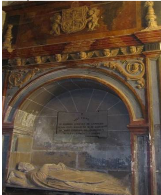
Sepulchro y escudo de los Jiménez de Cabredo.

En la estructura formada por los Jiménez de Cabredo se pueden apreciar hasta cinco escudos diferentes. En el portalón de entrada al hospital hay dos escudos que defienden la entrada. En la casa del fundador hay otros tres escudos, siendo uno de ellos igual al que flanquea la entrada al hospital y en el edificio de enfrente dos escudetes.