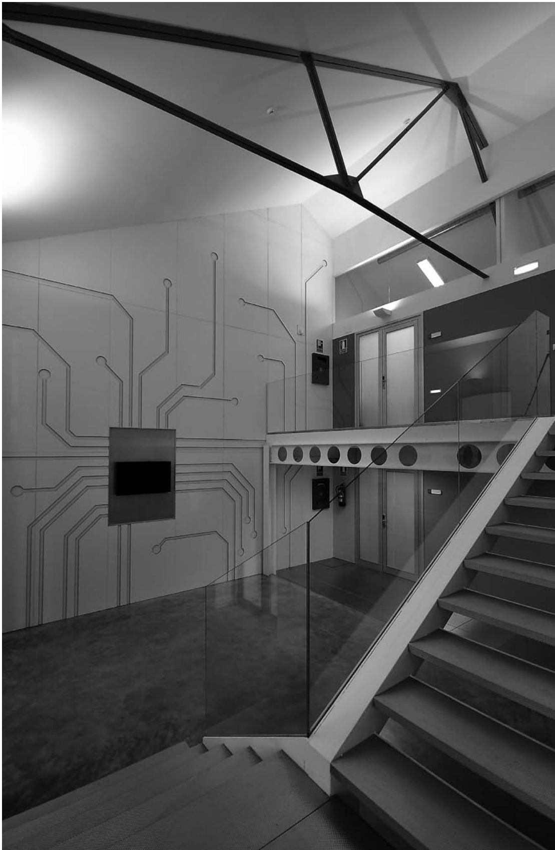
Fig. 5. Escalera metálica de acceso a planta primera.