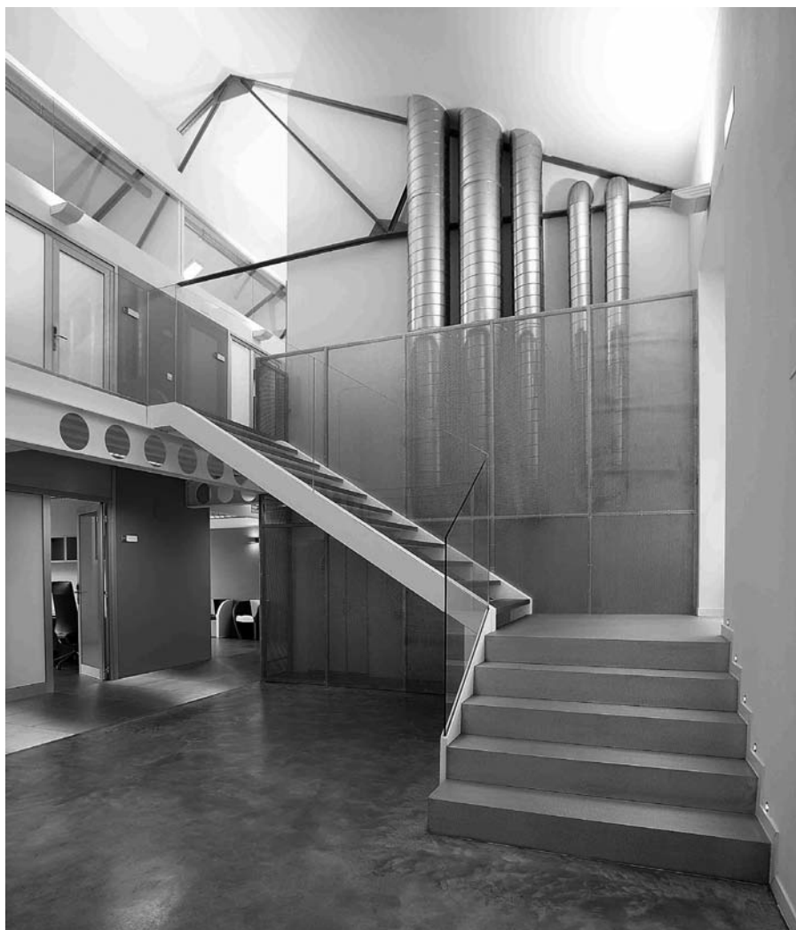
Fig. 4. Hall de entrada planta baja.

nes, como es el caso del espacio a doble altura del vestíbulo y escalera donde se muestra la volumetría original, así como elementos singulares de la construcción, como son las cerchas metálicas. Del mismo modo, el forjado de la primera se corta antes de llegar a tocar la fachada, pudiendo observarse también el volumen y la composición de huecos de la fachada, donde destacan la ventana circular y rectangular que presiden el pasillo.