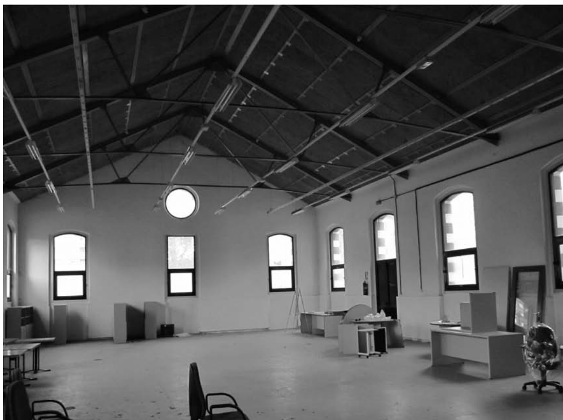
Fig. 1. Estado previo a la reforma de la nave-taller 115. Arriba, fachada y abajo, espacio interior objeto de la reforma.