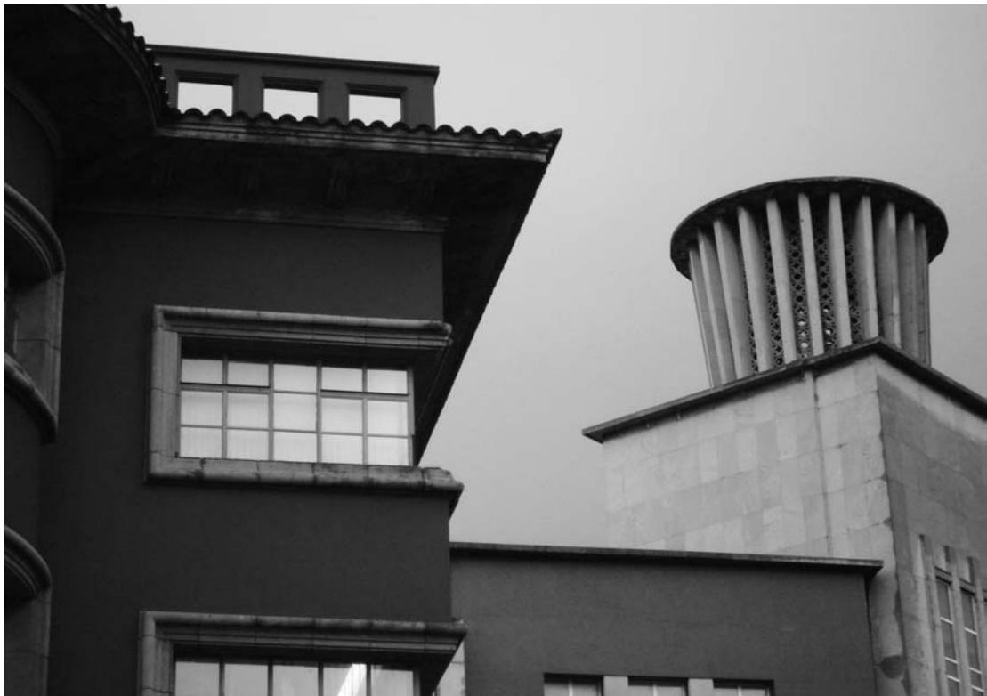
3) Detalle de la Casa Rosada con el edificio de Justicia, ambos de Pedro Cabello.