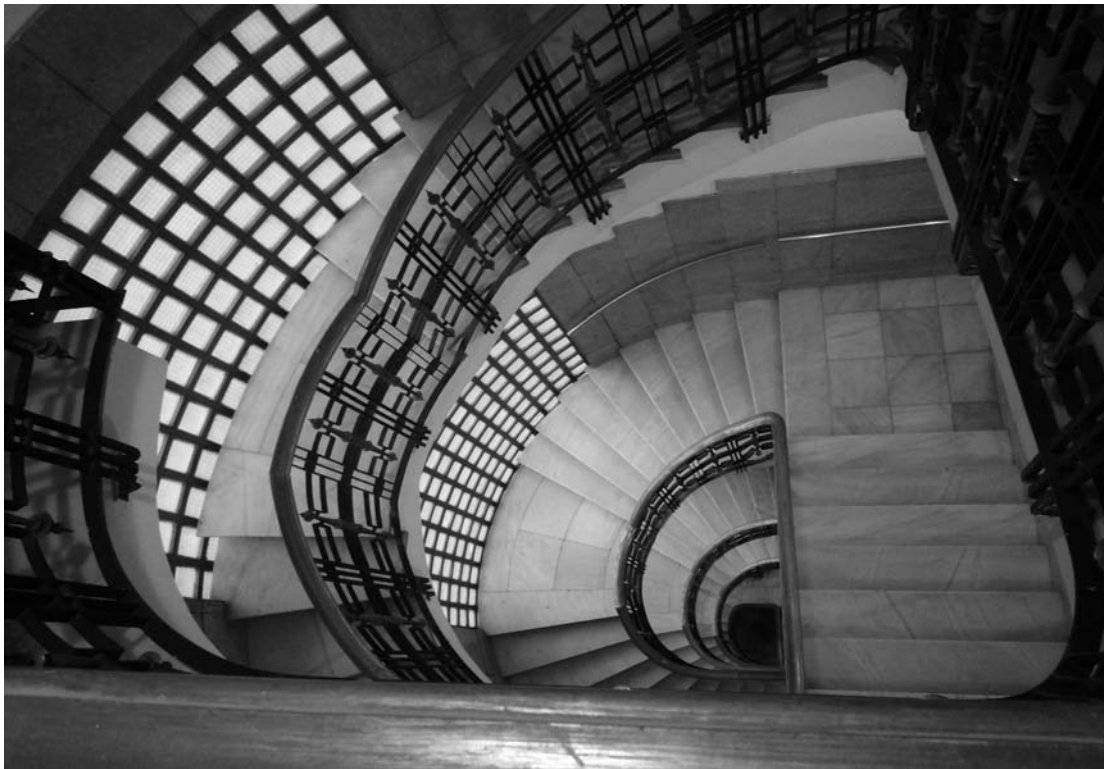
7) Escalera.

suelta. Esta decisión permitió conservar los solados, paredes y revestimientos de las mismas existentes en la actualidad, de gran calidad, y que en la actualidad resultaría muy problemático y caro de utilizar, aunque su conservación y presencia hablan de lo acertado de su elección y económico pese al fuerte gasto inicial en su día. Pero el problema importante surgió cuando se iniciaron las tareas de excavación del semisótano y observamos que a pesar de que el edificio no tenía problemas estructurales visibles carecía de una cimentación adecuada por lo que hubo que introducir una cimentación profunda a base de micropilotes que sustituyese a la existente.