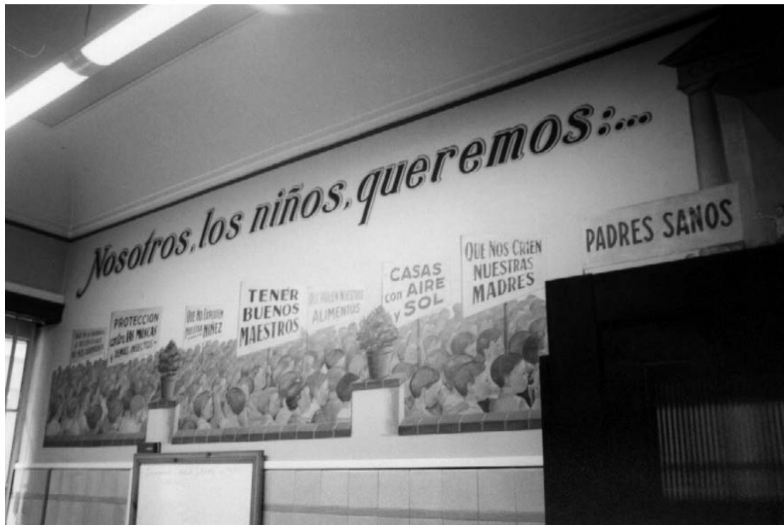
5) Interior mostrando dibujos didácticos.

El Hogar Materno Infantil, dentro del Plan General de Ordenación Urbana de Gijón, es un Equipamiento, SP, Servicio Público , está comprendido dentro de "Protección Arquitectónica". El edificio ocupa en planta 497,74 m 2 . Dado que cuenta con un semisótano ventilado e iluminado, para absorber la diferencia de nivel