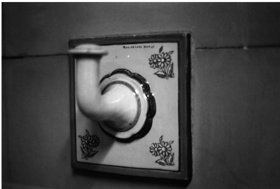
6) Perchero de cerámica de Talavera.

de la planta baja con la rasante, exteriormente se realiza una plataforma a un nivel intermedio, a la que se accede a través de una escalinata. Además del semisótano cuenta con baja, primera, segunda, tercera, cuarta y quinta como terraza de la última. Se encuentra rodeado por aceras, estrechas, para la escala y dimensión de la Casa Rosada.