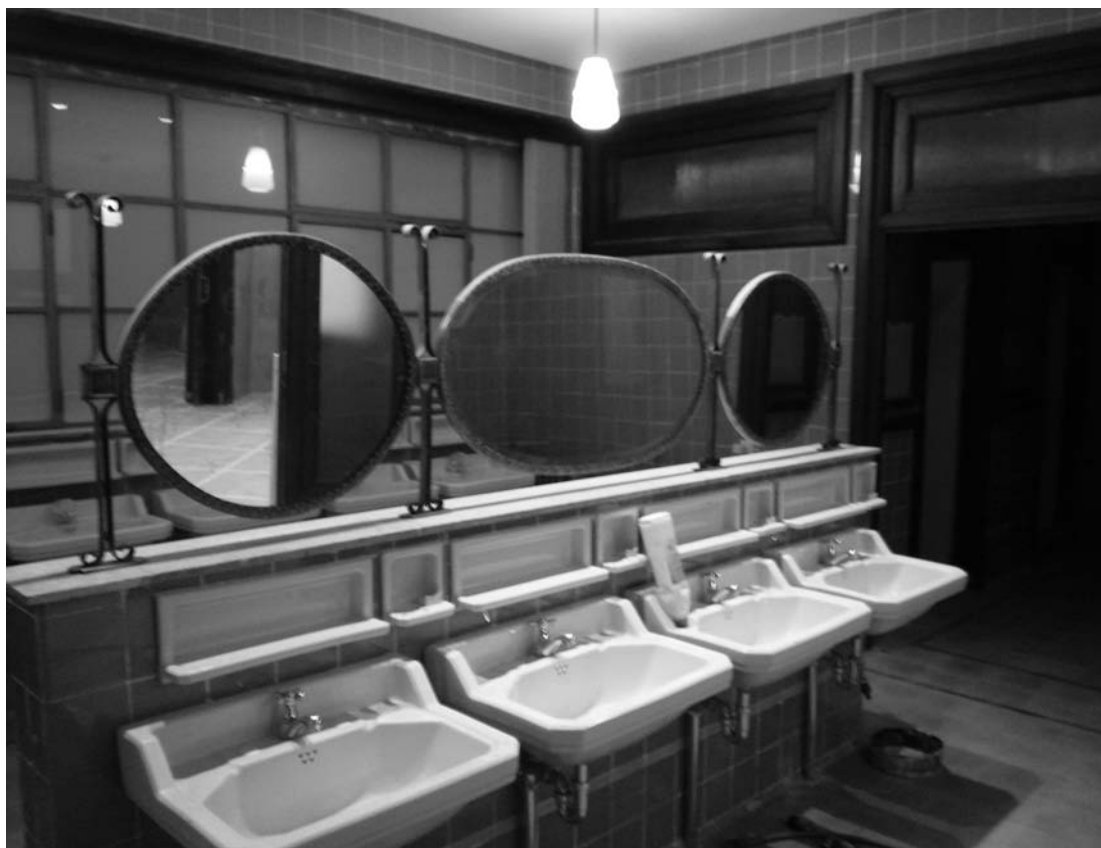
8) Aseos tras la restauración.

desmerezcan en el diálogo que van a mantener con lo existente.