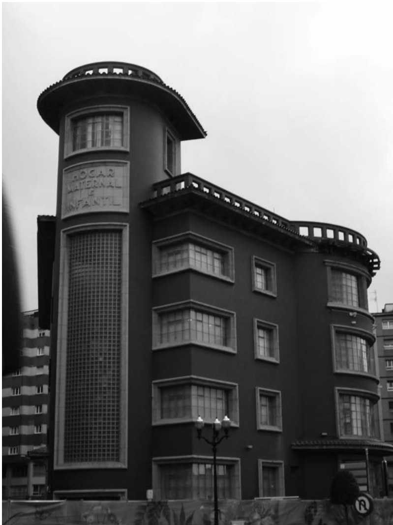
9) Edificio tras su restauración.