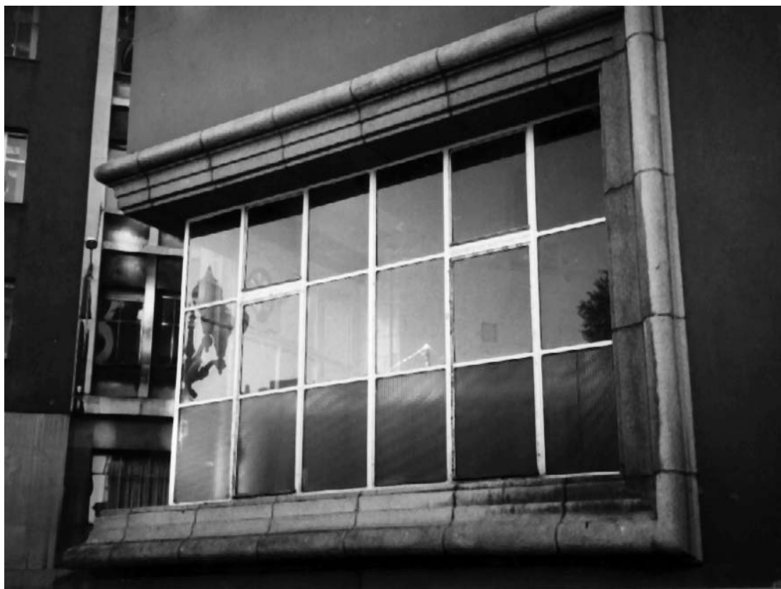
10) Carpintería antes de la intervención.

Stuttgart en la prensa de la época nos daremos cuenta de la situación.