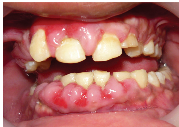
Figura 1. Foto inicial del paciente. Se observa agrandamiento gingival en ambos maxilares, las lobulaciones de la encía de color rosa, se observan zonas eritematosas.