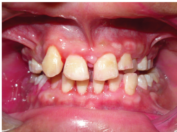
Figura 4. Evaluación a los 15 días de Gingivectomía maxilar superior y a los 30 días de intervención en maxilar inferior. Se observa inflamación gingival leve.