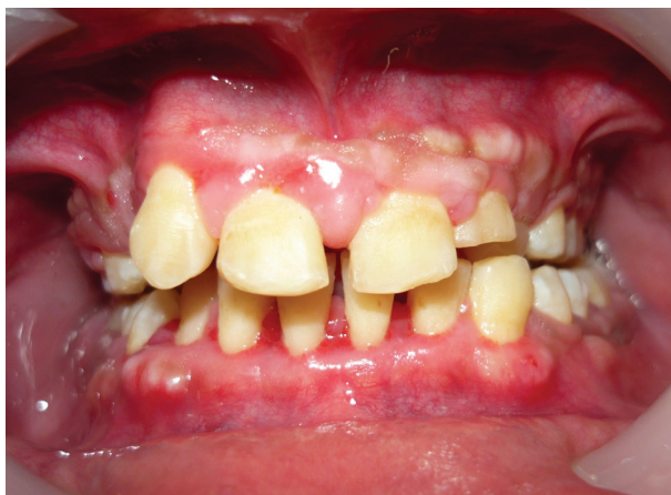
Figura 3. 15 días luego de la Gingivectomía del maxilar inferior. Se observan algunas zonas en proceso de cicatrización. En maxilar superior se observa disminución de la inflamación 1 mes después de la fase higiénica.