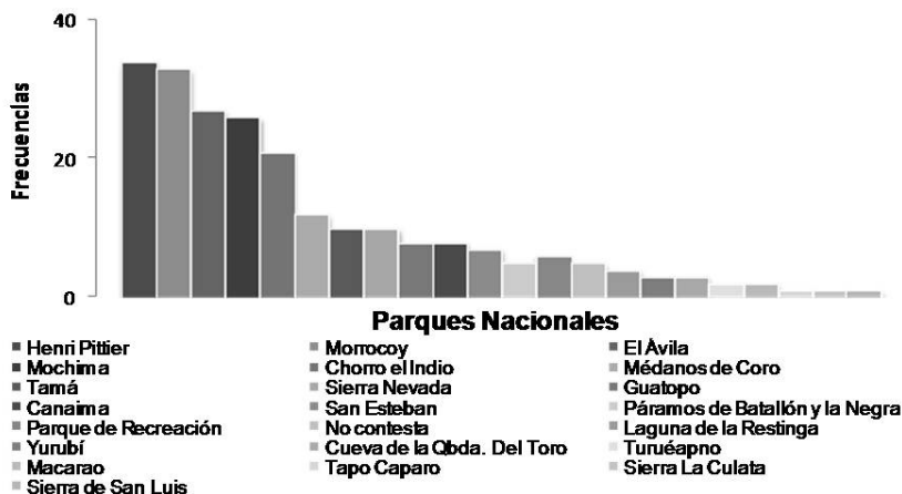
Gráfico 2. Parques Nacionales conocidos por los docentes entrevistados

(4%), con menor frecuencia se encuentran Canaima, Guatopo y San Esteban (3%), Páramos de Batallón; la Negra y; Laguna de la Restinga (2%), Yurubí y Cueva de la Quebrada del Toro (1%), Turuépano, Macarao, Tapo-Caparo, Sierra de la Culata y Sierra de San Luís fueron señalados con porcentajes menores a 1%.