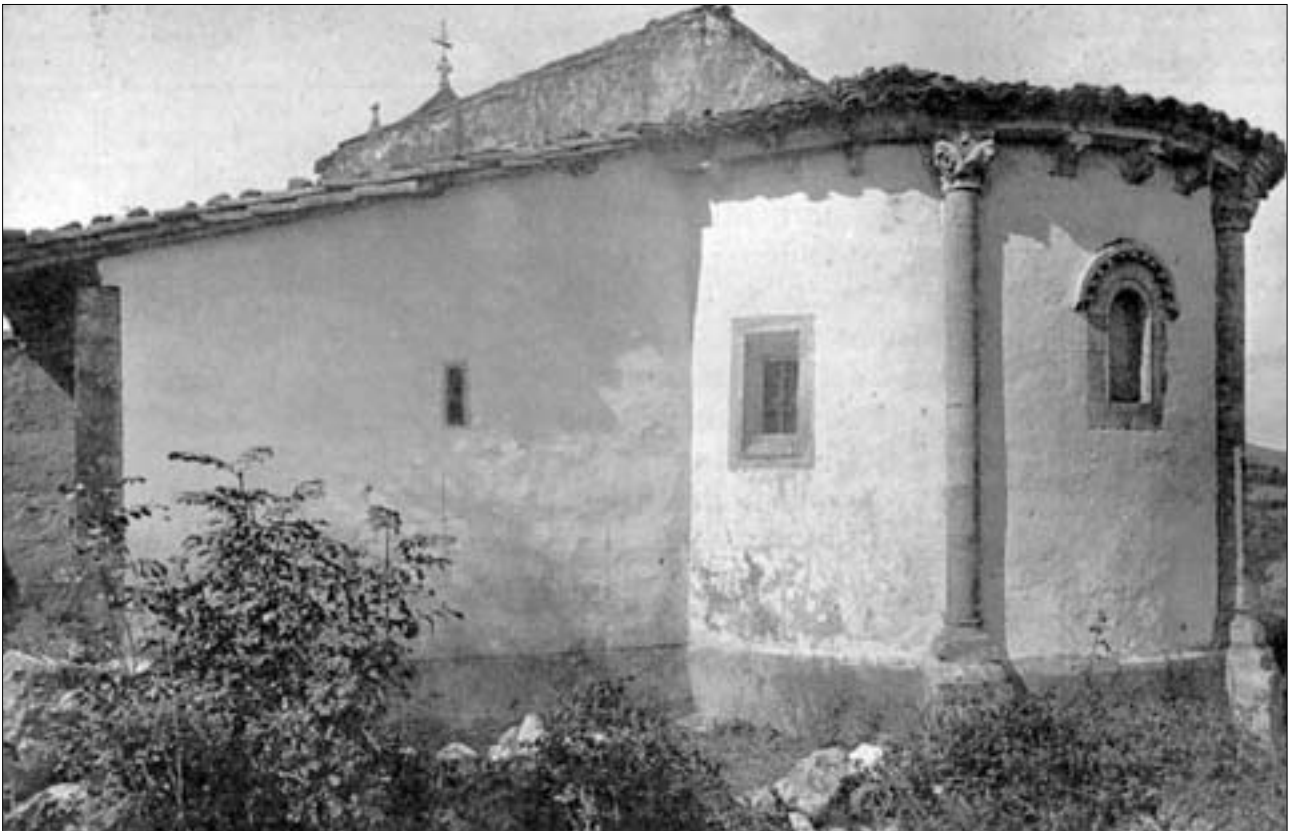
LA DESAPARECIDA IGLESIA ROMÁNICA DE VALSERA. FONDO FOTOGRÁFICO DEL RIDEA

Foto de portada: LUJÓ SEMEYES. Langreo http://500pix.com/lujo y www.flickr.com/lujo ; www.lucesfotografia.com Contacto: 696315189 / lujosemeyes@gmail.com