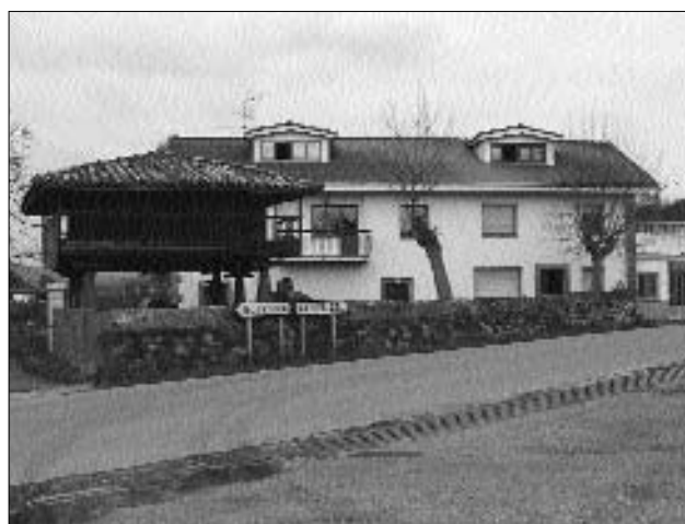
LA CASA DEL HOSPITAL DE ESCAMPLERO, HOY MUY REFORMADA.