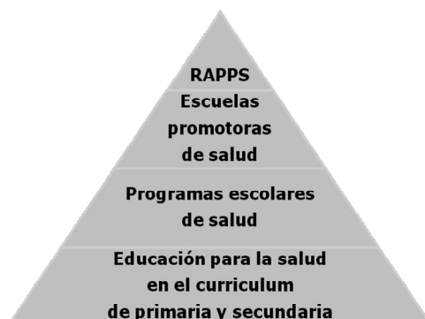
Figura 1: Niveles de implicación de los centros educativos respecto al tratamiento de la salud

La salud y la educación están mutuamente interrelacionadas (UIPES, 2.009 y 2.010) 4 5 . Uno de los determinantes principales de la