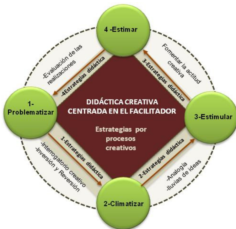
Gráfico 2. Didáctica creativa centrada en el facilitador.

En tal sentido, la didáctica creativa centrada en el facilitador como componente significativo en la educación universitaria y propósitos de la investigación, promueve las siguientes estrategias (gráfico 2):