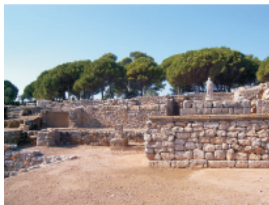
Ruinas del Asclepion de Ampurias (Gerona)

En la península Ibérica se han encontrado restos de antiguos templos de Asclepio en Ampurias (siglo IV a.C.), en la Almoína (siglo II a.C.).