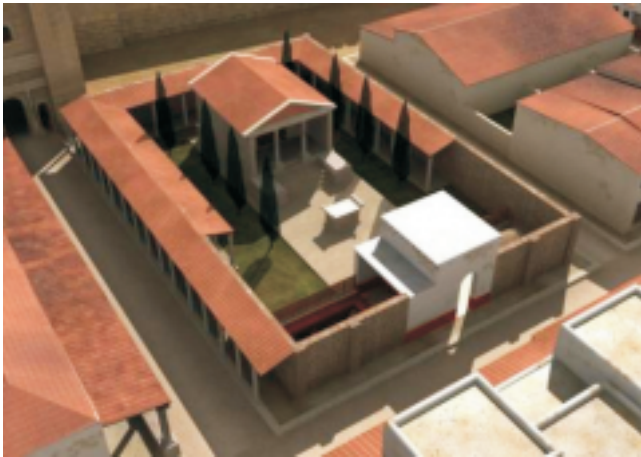
Recreación del Asclepion de l'Almoina (Valencia)