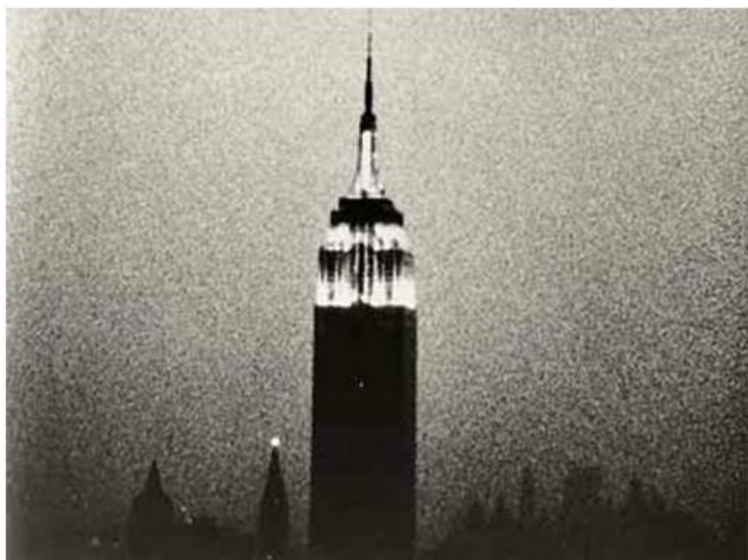
Ilustración 1. Andy Warhol, Empire, 1964.