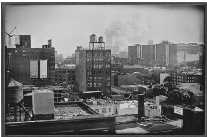
Ilustración 3. Jerry Spagnoli, Sin título, 2001.