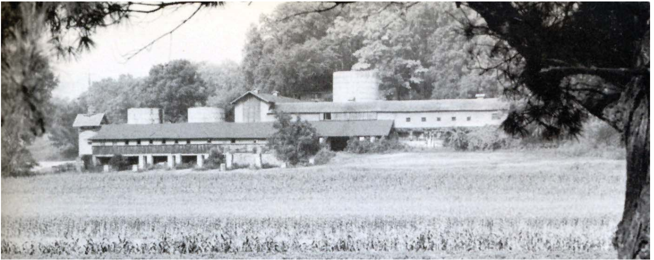
GRANJAS EN TALIESIN. HOFFMANN, DONALD: FRANK LLOYD WRIGHT: ARCHITECTURE AND NATURE , p. 15.

En ese momento, vi la vivienda, básicamente, como un espacio interior habitable bajo un cobijo ejemplar. Me gustaba la sensación de cobijo en el aspecto de un edificio. Todavía me gusta. La casa comenzó a asociarse con el terreno y a volverse natural al lugar de la pradera. 5