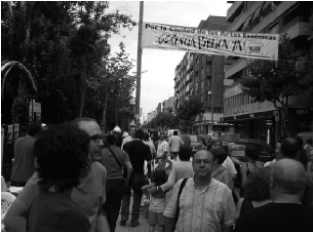
Toma de las calles en Injerencias! 2006.