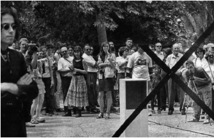
Fotografía de prensa, El país- Comunidad Valenciana, 7 junio 1998.