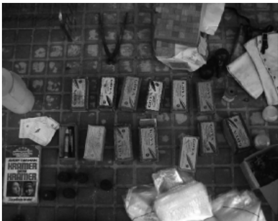
KOLEKTIVO OVNIPIERTO...O NO, Escaleras , 2006. Trueque, 2006.