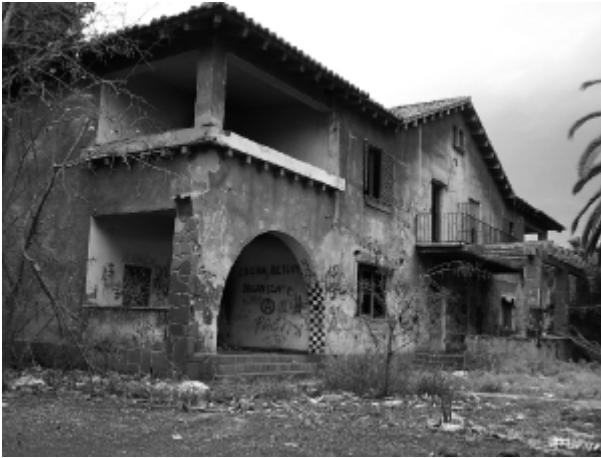
Un chalé de la Gerencia, Puerto de Sagunto, 2006.