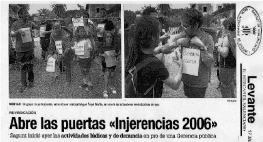
Fotografía de prensa, Levante , 17 junio 2006.