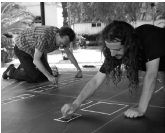
KOLEKTIVO OVNIPIERTO...O NO, Aviones de papel , 2006. J. J. Martínez, Camp de joc , 2006.