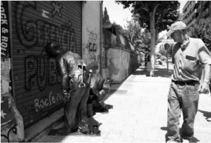
KOLEKTIVO OVNI PUERTO...O NO, El circo de la Gerencia , 2006.