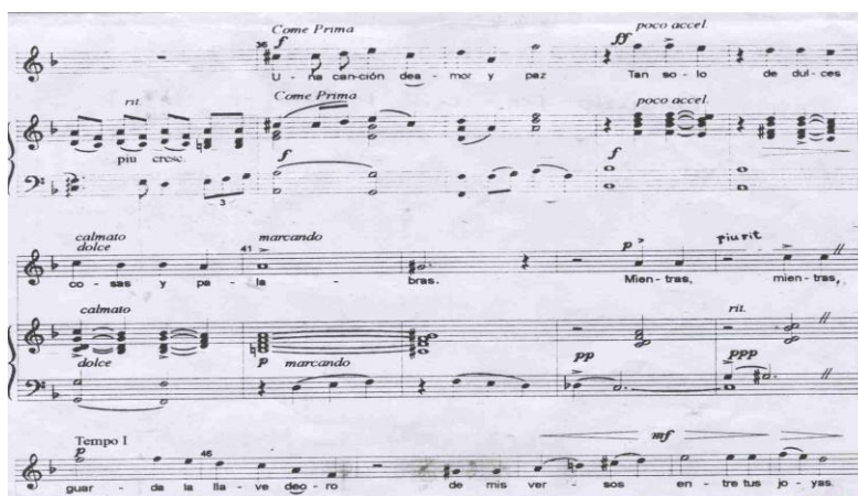
Ejemplo No 7: Fragmento de la canción Cuando sea mi vida -Hans Neuman (Del compás 35 al 44).

Analizando otros aspectos importantes en su obra podemos decir que en el tratamiento de la dinámica y la agógica está más apegado al impresionismo. El cambio continuo y contrastante de estos parámetros buscando un efecto colorístico, así como el uso del rubato otorga cierta inestabilidad a tempo como se muestra en el ejemplo No 7. (Observar: come prima, poco accel, calmado dulce, marcando, piu rit, tempo I).