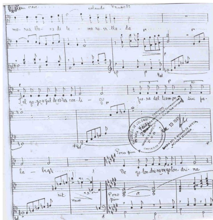
Ejemplo No 5: Fragmento de la Canción Lejana de Hans Neuman (Del compás 35 al 49).

Por otra parte, el ambiente creado por la amplia pedalización provoca un enriquecimiento de la melodía y un cantábile más expresivo visible en toda su obra. Podemos citar cualquier pasaje de su creación y nos damos cuenta de la similitud existente con los ya citados compositores del romanticismo e impresionismo, muestra de ello es el ejemplo No 6.