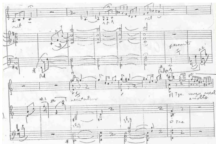
Ejemplo No. 6: Fragmento de la obra Momento Musical para violín y piano de Hans Neuman (Del compás 110 al 117).

Analizando otros aspectos importantes en su obra podemos decir que en el tratamiento de la dinámica y la agógica está más apegado al impresionismo. El cambio continuo y contrastante de estos parámetros buscando un efecto colorístico, así como el uso del rubato otorga cierta inestabilidad a tempo como se muestra en el ejemplo No 7. (Observar: come prima, poco accel, calmado dulce, marcando, piu rit, tempo I).