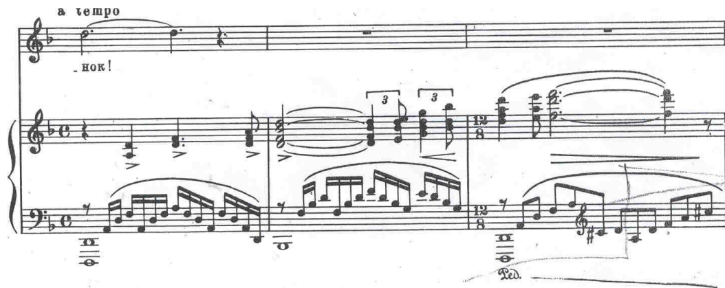
Ejemplo No 4: Fragmento de la canción De nuevo solo de S. Rachmaninoff. 5