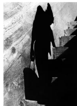
ALGUNES FOTOGRAFIES D'HERVE QUE ES VAN PODER VEURE A L'EXPOSICIÓ: LA CITÉ RADIEUSE, MARSELLA, 1949; CHANDIGARH, 1955; I LA CAPELLA DE RONCHAMP (INTERIOR I EXTERIOR, 1957).