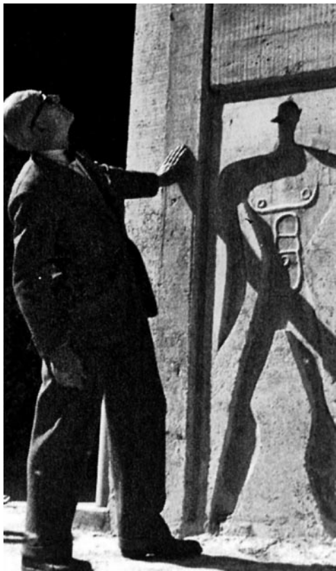
LE CORBUSIER A LA CITTE RADIEUSE, MARSELLA, 1949.

Léger, i també havia intercedit perquè Le Corbusier projectés el Convent de la Tourette, va suggerir a al fotògraf hongarès que anés a Marsella per fotografar l'obra de la Unité d'habitation . A finals del novembre del 1949, Hervé havia realitzat en un sol dia més de sis-cents clixés de l'obra amb la seva Rolleiflex. Hervé va enviar la totalitat de les fotografies a l'estudi de l'arquitecte a la rue de Sèvres de París. En una carta prou coneguda, Le Corbusier va respondre al fotògraf entusiasmat pel seu treball dient-li que tenia "ànima d'arquitecte" i que coneixia la manera de "veure l'arquitectura". D'aquesta manera va començar una associació que s'acabaria el 1965, data de la mort de Le Corbusier. L'arquitecte va utilitzar les fotografies d'Hervé àmpliament —més de 20.000 clixés que constitueixen una documentació de primera mà— pels últims volums de les seves Oeuvres complètes (5–7), així com per la majoria dels seus articles publicats entre els anys cinquanta i seixanta a revistes com L'architecture d'Aujourd'hui , Domus o Jardin des Arts .