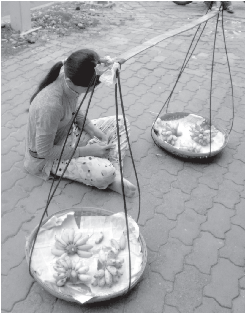
INFORMALIDAD GLOBALIZADA (CALLES DE HO CHI MINH CITY, VIETNAM) Ángela Ospina, 2010. Archivo de la autora