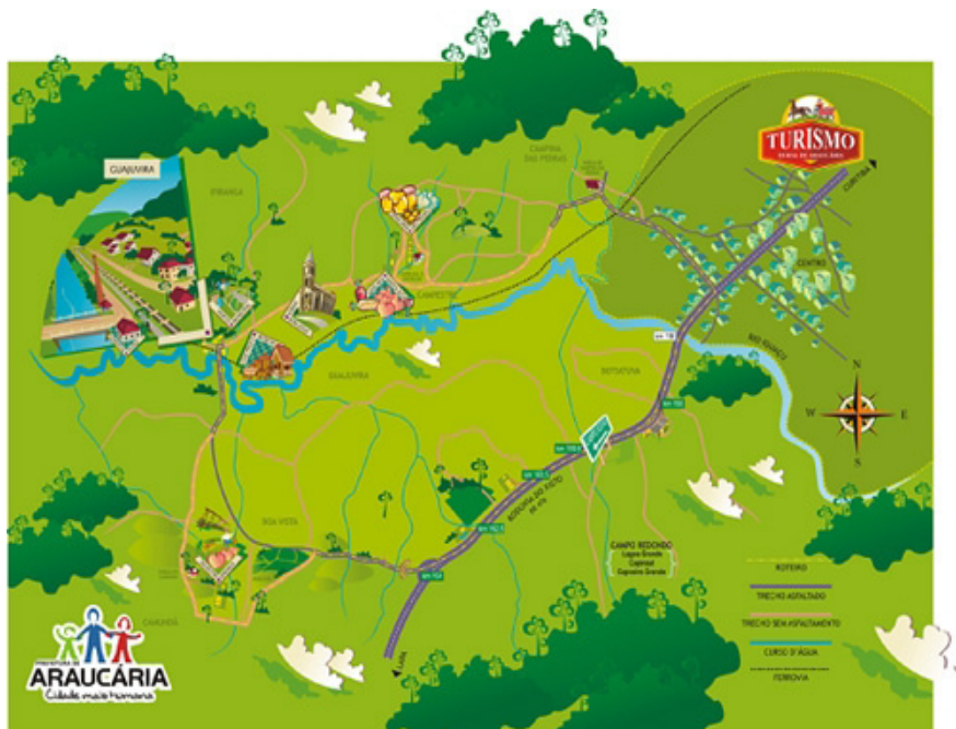
Figura N° 4 - Itinerário Caminhos de Guajuvira