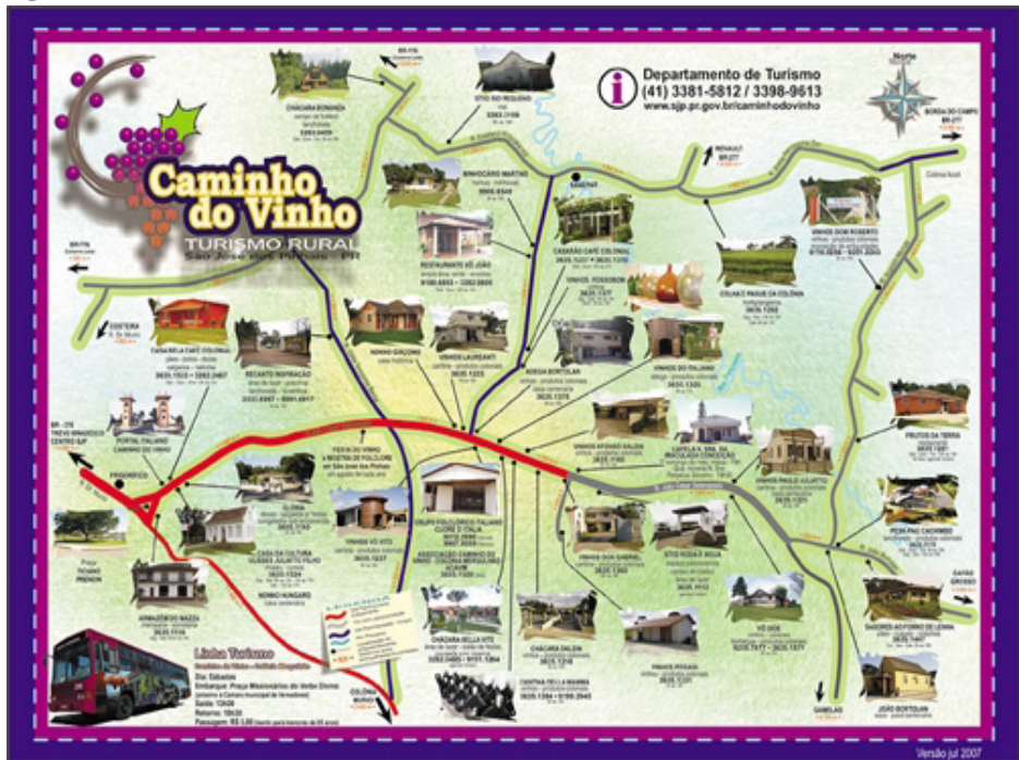
Figura N° 3 – Itinerário Caminho do Vinho