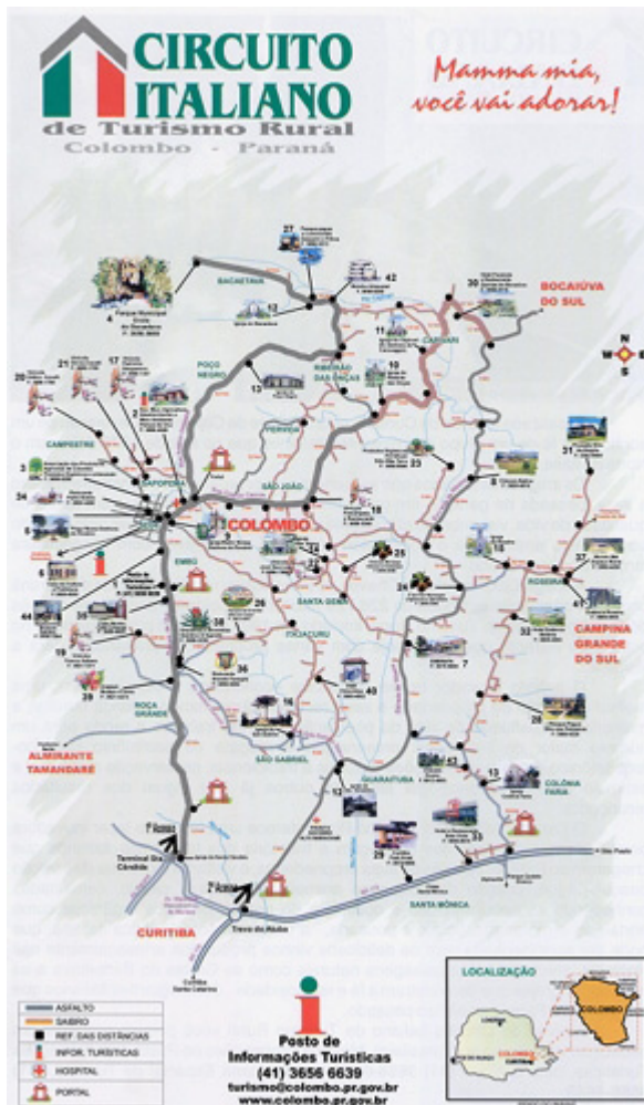
Figura N° 2 – Itinerário Circuito Italiano de Turismo Rural