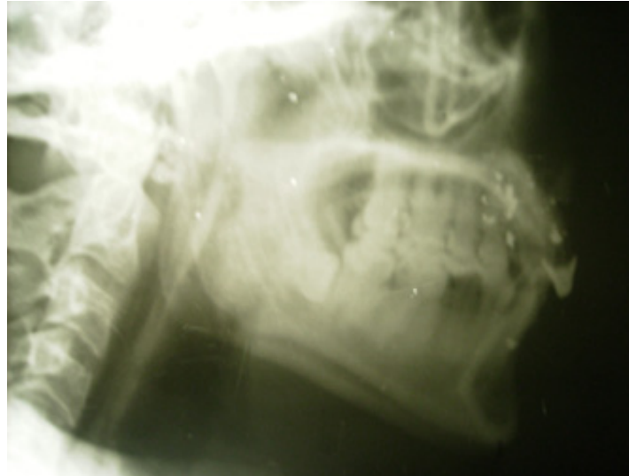
Figura 2. Radiografía de perfil de cráneo observándose esquirlas a nivel de maxilar superior