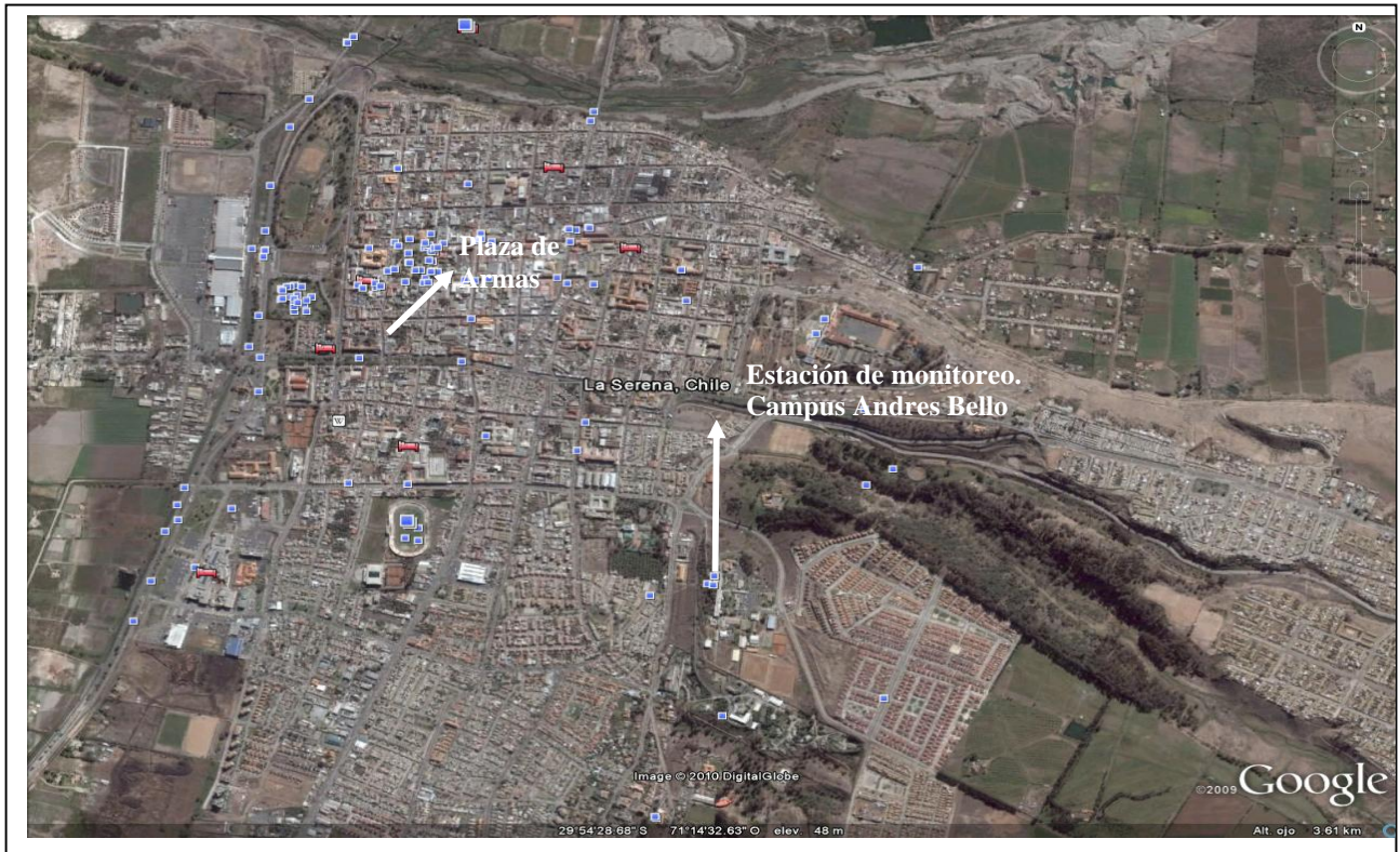
Fig. 1: Muestra el sector de ubicación de la estación de monitoreo.

Para cuantificar la concentración de los metales, los filtros que contenían el material particulado, se trataron de la siguiente manera: en primer lugar se cortaron con tijeras de fibra de plástico y se sometió a un ataque ácido con agua regia (1 \text{HNO}_3 :3 \text{HCl} en volumen) a 90^\circ\text{C} , enseguida, se filtra, la solución resultante se lleva a sequedad y se afora con agua destilada y desionizada, acidificada con ácido clorhídrico, todos los reactivos empleados tienen la categoría para análisis (P.A.) (Zamarreño et al., 2003).