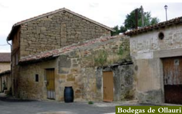
Bodegas de Ollauri

La introducción de redes de instalaciones urbanas ha conllevado, en algunos casos, sinietros significativos. Y su estabilidad, desde el punto de vista arquitectónico y constructivo, en muchas ocasiones comprometida.