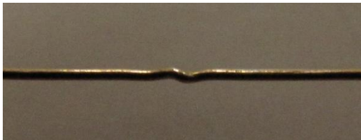
FIGURA 3. La imagen muestra una sección de uno de los alambres que se les proporciona a los estudiantes, amplificado unas 40 veces.

Que la regla sea el instrumento que contribuye con la menor incertidumbre es algo que no esperaban los estudiantes, y es entonces cuando surgen las preguntas: