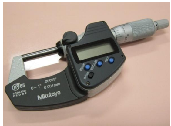
FIGURA 5.- El tornillo micrométrico indica en su manual que tiene una resolución de 1\mu\text{m} , y también indica que el error asociado a la medida es de 0.5 \mu\text{m} .