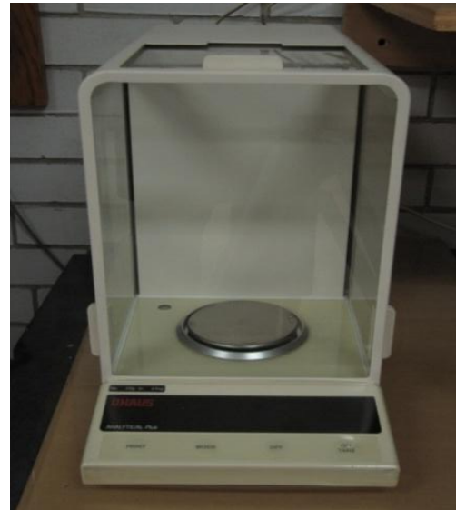
FIGURA 4.- La Electrobalanza analítica indica en su manual que tiene una resolución de hasta 0.1 mg. Sin embargo, el mismo manual, indica que el error asociado a la medida de masa es de 0.2 mg.

otra alternativa para no exigir tanta resolución a los instrumentos (cuando el experimento lo permite), es la de cambiar el tamaño de la muestra.