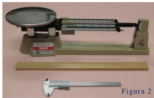
FIGURA 2. Aquí se muestra el equipo que se les proporciona a los estudiantes para que determinen la densidad del alambre.

El diámetro del alambre se mide con el calibrador con vernier, cuya resolución es de 0.05 mm (ver figura 1), que dentro de los esquemas del estudiante es considerado de buena resolución; y aquí su argumento es que “tiene muchas divisiones”. Pero, el diámetro del alambre es apenas 6 veces mayor que la mínima división del instrumento.