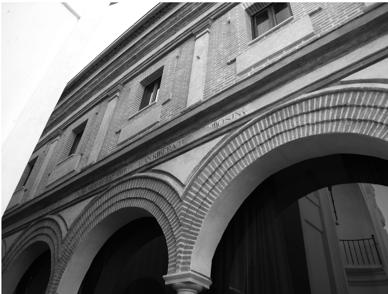
Vista del Convento de San Francisco