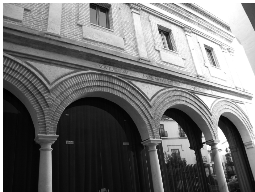
Vista del Convento de San Francisco

La parte intermedia de la inscripción dice: "Siendo VCR PL NMRP RAN, RIBERA, TOD {¿S?}". Las dos palabras que pueden ser claves para la interpretación son "RIBERA" que, por el título de MRP ha sido o es Ministro Provincial de la Provincia, o Vicario elegido por el Definitorio de la Provincia, y la palabra "VICARIO" (PROVINCIAL), que hace alusión a una situación particular de la Provincia Franciscana, en la que no hay