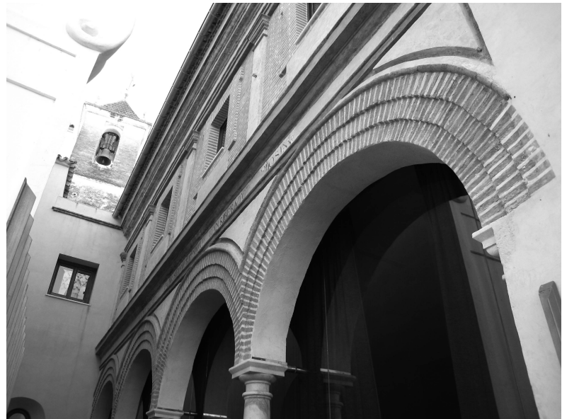
Vista del Convento de San Francisco