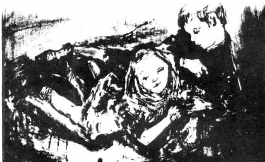
Kokoschka: Niños jugando . 1909. Duisburg, Kunstmuseum.

Tomado de: Gombrich, Ernst H. Historia del arte. - - Madrid: Alianza, 1982. p. 476.