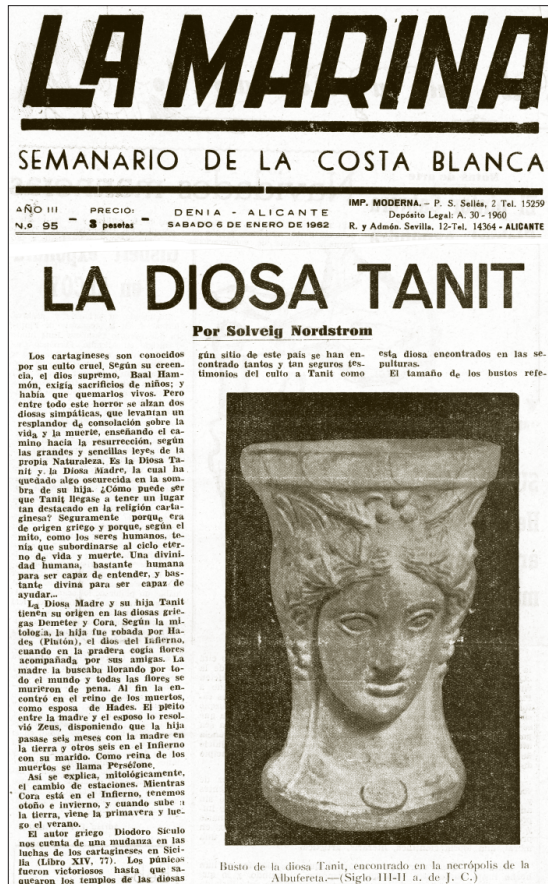
Lám. 4. Recorte de prensa con un artículo de S. Nordström sobre la presencia de Tanit en Alicante

de al poblado del Oral, era interpretada como el resultado de la primera invasión cartaginesa 11 , al identificar a los enterrados como mercenarios al servicio de los cartagineses a partir de las armas «ibéricas, celtas y griegas» de los ajuares. Para esta autora, la segunda invasión cartaginesa de la Península Ibérica se producía como consecuencia de la derrota de Sicilia y de la siguiente revuelta de los mercenarios en Cartago. En la costa alicantina, esta invasión significaba la creación de Akra Leuké , próxima a la colonia masaliota fundada a finales del s. IV a.C., Leukon