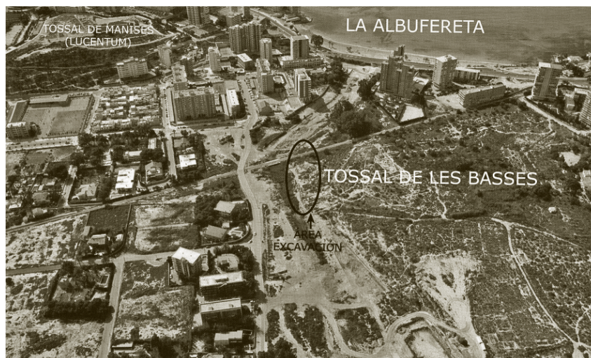
Lám. 10. Vista aérea actual del conjunto arqueológico de l'Albufereta con la situación del área de excavación del barrio portuario a extramuros del Tossal de les Basses (tomado de M.A. Esquembre y J.R. Ortega [coords.] [2008])

ramiento, tema objeto de análisis por el autor en esta misma publicación. Otros datos como la escasa incidencia de las armas en los ajuares, el busto de terracota idéntico a los bustos de Tانيت de Puig d'es Molins, los amuletos egipcios y orientales, las terracotas únicas en esta necrópolis, el amplio repertorio de vasos ibicencos y púnicos utilizados como contenedores de ofrendas, la forma tumular y ritual de enterramiento colectivo de la tumba L-127, por citar algunos, deberán ser objeto de una pausada reflexión.