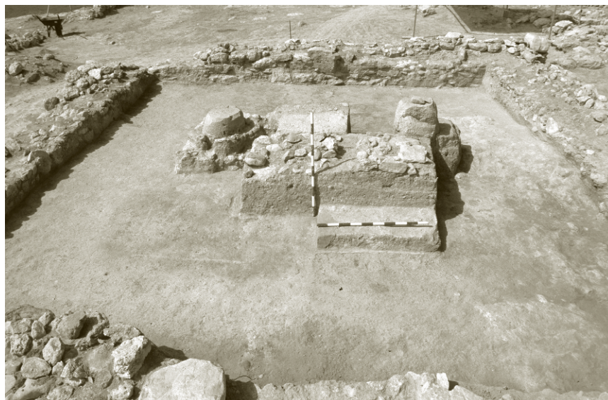
Lám. 6. Vista final de la excavación del templo B

esta misma obra, y porque se acaba de publicar el primer volumen de las memorias de excavación de Enrique Llobregat 26 , donde el lector podrá encontrar la información por extenso. Interesa ahora destacar que el mismo investigador que unos años antes negaba cualquier impronta púnica en la cultura ibera, al describir su excavación en el templo B, identificaba las estructuras de su interior con la masseba y la asherá de los lugares de culto orientales (Lámina 6); consciente de su trascendencia, dio a conocer muy pronto el pequeño altar de piedra que junto a un pebetero de cabeza femenina constituían los dos únicos objetos para la liturgia del templo B. 27 Los dos templos y el almacén del templo A presiden un establecimiento construido con un planificado urbanismo regular; un establecimiento en el que las evidencias de actividades artesanales, con el esparto, con las salazones de pescado... aparecían abundantemente en la excavación; la extraña elección de un lugar desha-