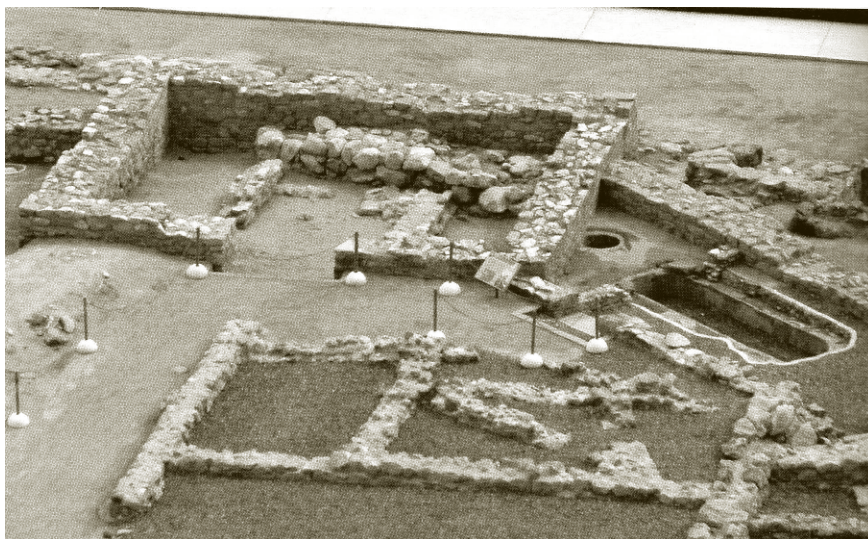
Lám. 9. Casa del patio triangular con la cisterna y la poceta de decantación junto a la torre VI (tomado de M. Olcina [2009]: 104)

dono repentino, dejando in situ un contexto material intacto similar al Tossal de Manises. Como ya hemos señalado en otras publicaciones 38 , es muy probable que se tratara de acciones estratégicas del ejército romano con el objeto de cuidar la retaguardia en su camino hacia la capital cartaginesa.