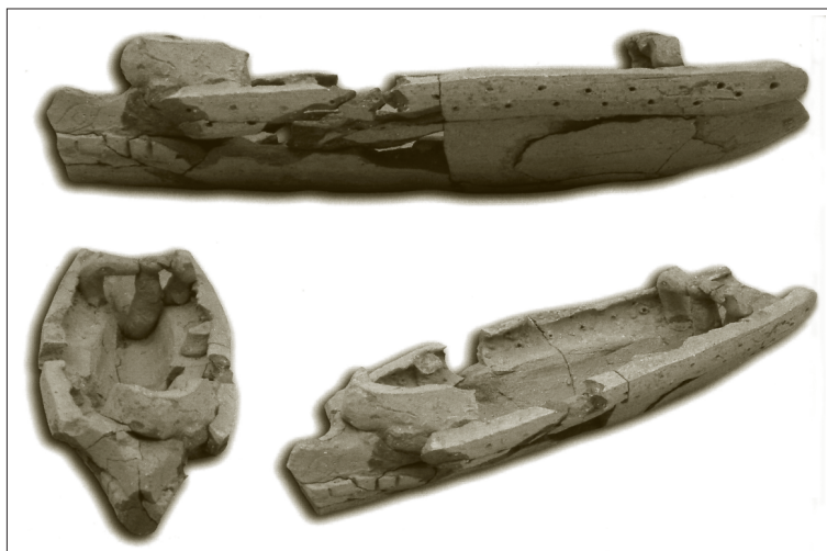
Lám. 11. Diferentes vistas de la birreme (tomado de M.A. Esquembre y J.R. Ortega [coords.] [2008])

El estudio del mundo púnico en el solar peninsular se ha visto influido por muchos prejuicios desde los inicios de la investigación, prejuicios que han afectado especialmente a la interpretación de los datos arqueológicos, como de forma acertada afirma E. Ferrer 44 . En la arqueología del s. XXI, no podemos seguir contemplando la documentación arqueológica como algo ambiguo. El documento material es objetivo, en tanto que es algo creado de forma involuntaria y, por tanto, debería tener una sola interpretación. El problema radica, como hemos visto a lo largo de las páginas precedentes, en la perspectiva desde la que el historiador se aproxima a la documentación. Sería necesaria una primera cura de auxilio consistente en revisar la confusa documentación arqueológica antes de introducir ningún modelo teórico 45 . C. Aranegui y J. Vives-Ferrándiz 46 han propuesto recientemente un proceso de mestizaje en la conformación de sociedades híbridas, en las que