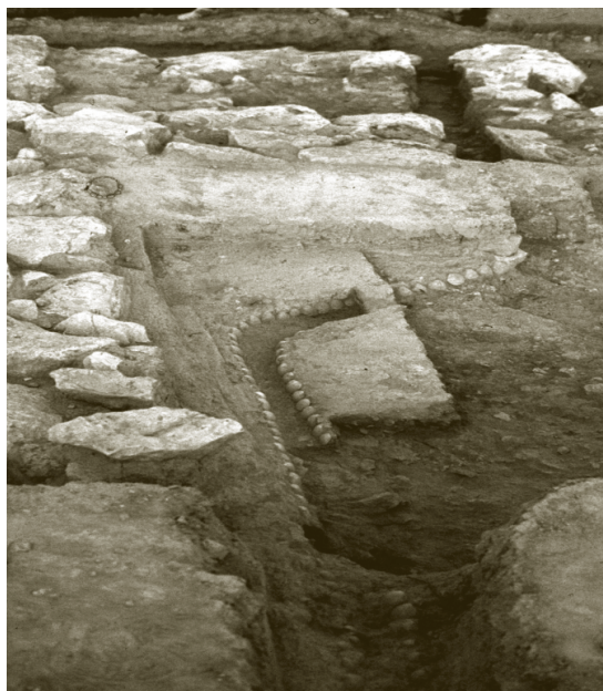
Lám. 8. Vista del canal de conchas de la estancia VIII D2 del Oral; al fondo, el canal atravesando la muralla

Así pues, lo púnico vuelve a estar presente en los territorios ibéricos de la costa alicantina. Regresamos al punto en el que se encontraba la arqueología de los primeros estudios, pero,