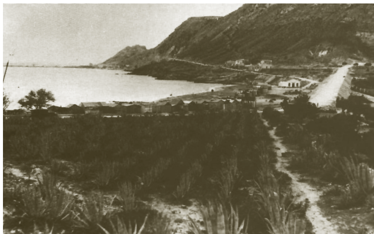
Lám. 2. Imagen de la playa de l'Albufereta en los años 30 tomada desde el Tossal de Manises. Al fondo el Benacantil, a continuación las sierras de San Cristòfol y Grossa. A la derecha, fuera de la imagen, estarían la albufera y el poblado del Tossal de les Basses

pero refiriéndose claramente a la fundación bárquida de Akra Leuké . Lafuente argumentaba que los colonos griegos se referirían a los acantilados de color blanco de la costa con el término leukon , nombre que, según este autor, mantendría Amílcar años después para su base. Defendía también que el Benacantil, promontorio a cuyos pies se extiende la actual ciudad de Alicante, fue el lugar elegido por Amílcar para su fundación, ya que su cima es bastante más elevada que la del Tossal de Manises (Lámina 2).