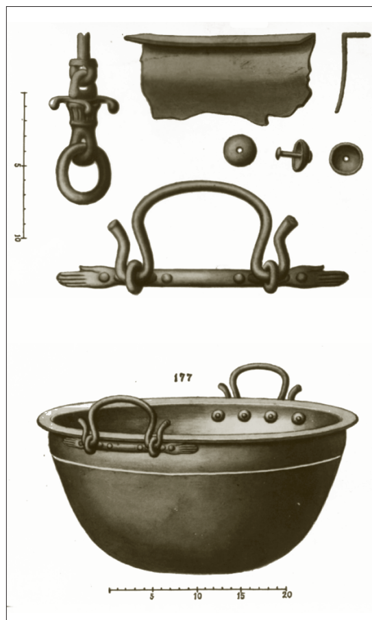
Lám. 3. Recreación del brasero de bronce de la tumba 62 de l'Albufereta publicado por F. Figueras ([1959]: lámina V) como braserillo púnico de manos estilizadas. Asas idénticas de Puig d'es Molins las publicaba también A. Vives Escudero ([1917]: lám. XVII)

Como se ha dicho, el final de esta etapa de la historiografía alicantina viene marcado por la