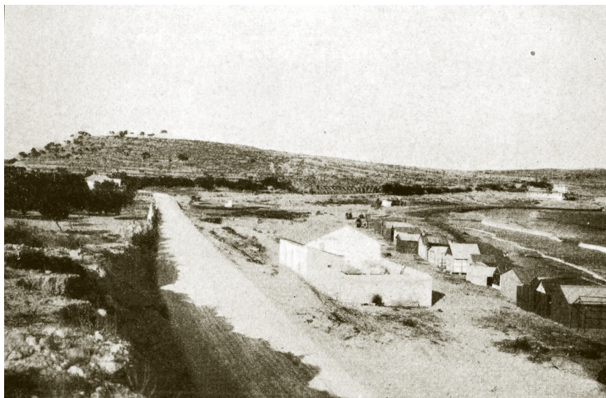
Lám. 1. Vista del Tossal de Manises y de la playa de l'Albufereta de los años 30

ciudad (Lámina 1). En todo el término municipal de Alicante, éste era el único yacimiento que había sido objeto de atención de los cronistas y estudiosos desde el siglo XVII 5 . La idea principal de su comunicación seguía el argumento de R. Chabás en el mencionado artículo de 1889, y atribuía el significado del nombre griego, Akra Leuké , lugar elevado de color blanco, a los acantilados de piedra calcárea blanquecina de las sierras Grossa y de San Cristòfol que se suceden en la línea costera entre l'Albufereta y la ciudad de Alicante. El resplandor reflejado por estos promontorios era visible desde el mar y, muy probablemente, constituyeron una referencia para la navegación antigua, como lo fueron hasta tiempos recientes. Pierre Paris, presidente de la sesión del congreso en la que intervenía F. Figueras, manifestó su conformidad con esta