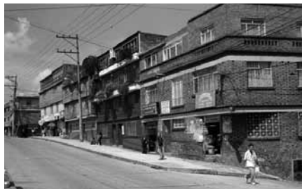
Figura 1. Calle en la localidad de Fontibón, Bogotá.

En segundo lugar, la capital de Colombia es una ciudad de clima frío, especialmente en la noche, que es cuando se llega a la casa después del trabajo o del estudio. El espacio cerrado genera calor; pero también genera