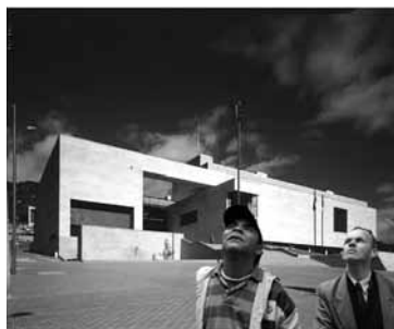
Figura 2. Desierto de ladrillo