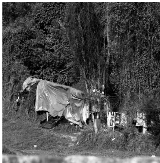
Figura 3. En las etapas iniciales de esta vivienda efímera urbana cerca al centro de Bogotá, puede apreciarse el valor que adquieren elementos que en algún momento han sido considerados basura.

Cuando nos referimos a la relación entre arquitectura y lugar, así como cuando nos referimos a la mayoría de puntos tratados en este artículo, necesariamente estamos hablando de aspectos socioculturales. En su libro House Form and Culture , 19 Amos Rapoport manifiesta que, aunque es claro que en la forma de