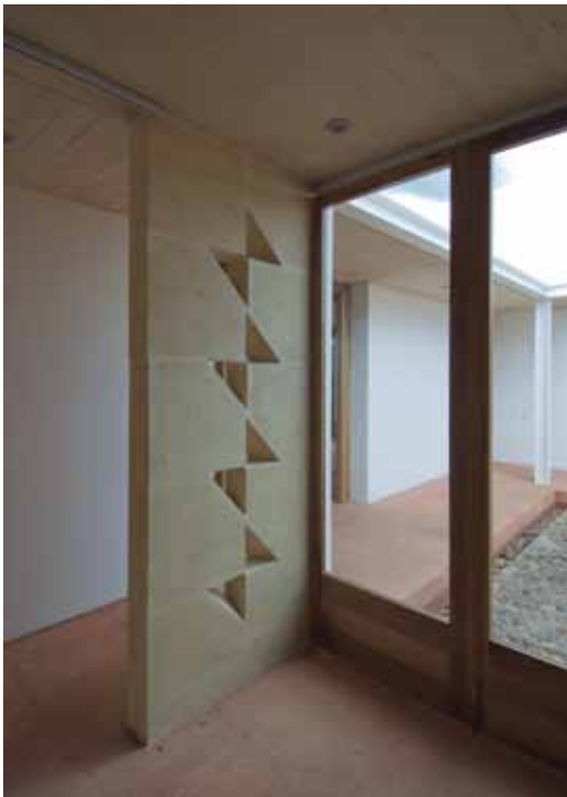
Figura 11. Detalle de acabados interiores en el comedor.