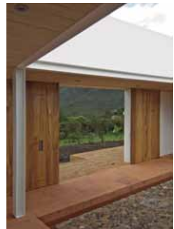
Figura 3. Vista hacia el exterior desde el primer patio.

Con la implantación rotada de la vivienda sobre la elevación donde se asienta, la villa en Villa de Leyva alcanza una panorámica completa de