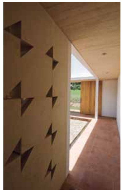
Figuras 8 y 9. Recorridos perimetrales en torno a los patios.