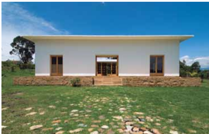
Figura 2. Vista frontal de la fachada suroccidental.

Para cumplir con su cometido ideológico, la villa debe interactuar de alguna manera contemplativa con su entorno físico. En este caso, la casa propuesta por Fischer toma una actitud formal antitética, con la cual procura una distancia contemplativa y no una mimesis formal respecto a la naturaleza.