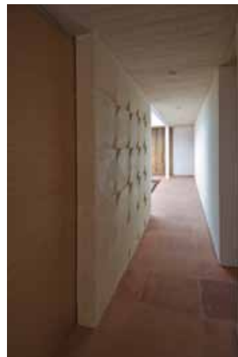
Figura 14. Detalle de la celosía escultórica que separa los espacios.