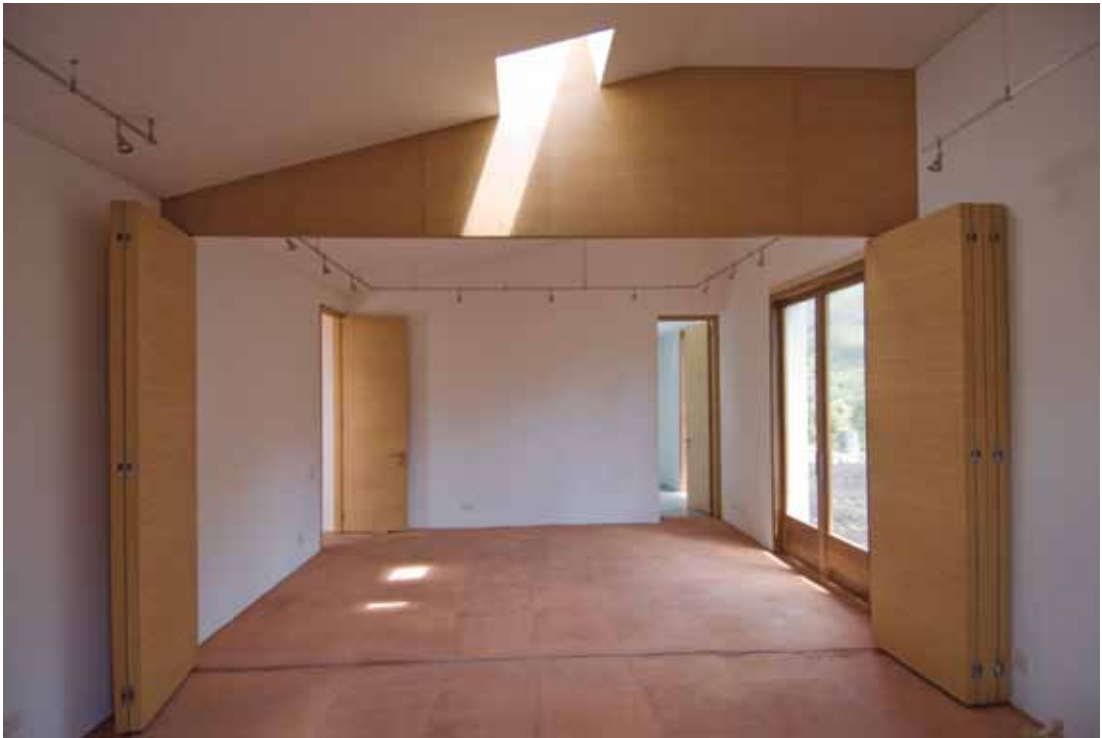
Figura 10. Sistema divisorio que permite transformar dos espacios en uno.