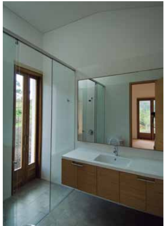
Figura 12. Detalle de acabados interiores en un baño.