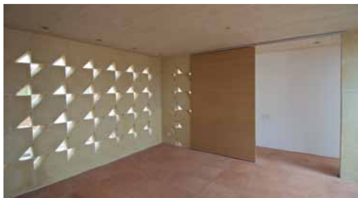
Figura 13. Recorrido perimetral por el sistema de circulación de la casa.