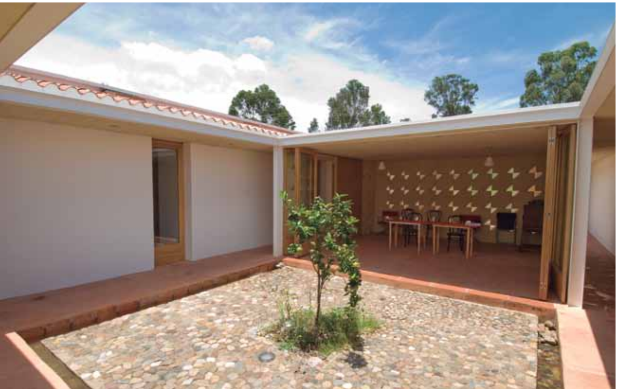
Figura 7. Vista interior del comedor y el primer patio.