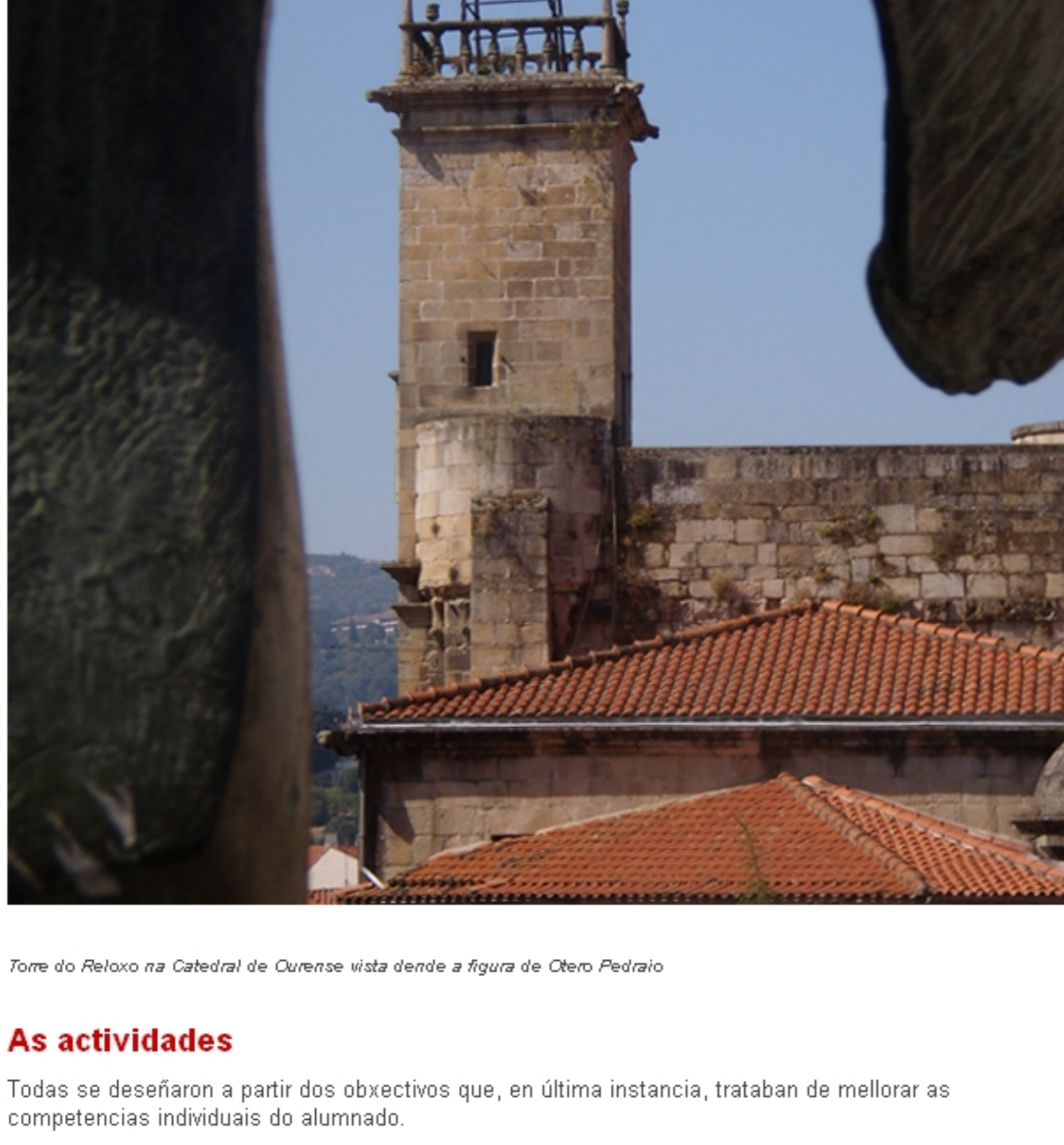
Tome do Reloxo na Catedral de Ourense vista dende a figura de Otero Pedrayo

Durante a viaxe non ofreciamos contestacións moi concretas, agás aquelas que, sobre a arquitectura civil ou relixiosa, necesitaban dunha rápida resposta. O que pretendíamos era que fosen autónomos na procura de solucións. Nós limitábamonos a equipalos dos instrumentos necesarios para valerse por si. É dicir, falámoslles da Lei de Mendizábal, pero eles debían atopar as súas consecuencias. De igual maneira que os informamos sobre os diferentes tipos de enterramentos urbanos, para que puidesen atopar un cemiterio en desuso e o motivo da súa situación. Desexabamos favorecer a discusión en grupo, que aprendesen a interpretar a realidade e o porqué das cousas.