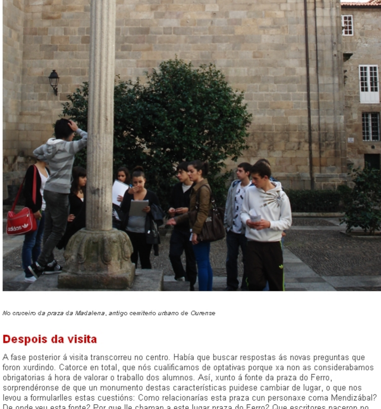
No ocoeiro da praza da Malabena, antigo ocoeiro urbano de Ourense

Talvez o máis salientable desta experiencia sexa o feito de "palpar" fisicamente a morea de creadores, as súas obras ou os recordos que Ourense garda deles. Na memoria dos nosos estudantes queda agora a idea de que este núcleo urbano foi dende sempre unha "cidade da cultura".