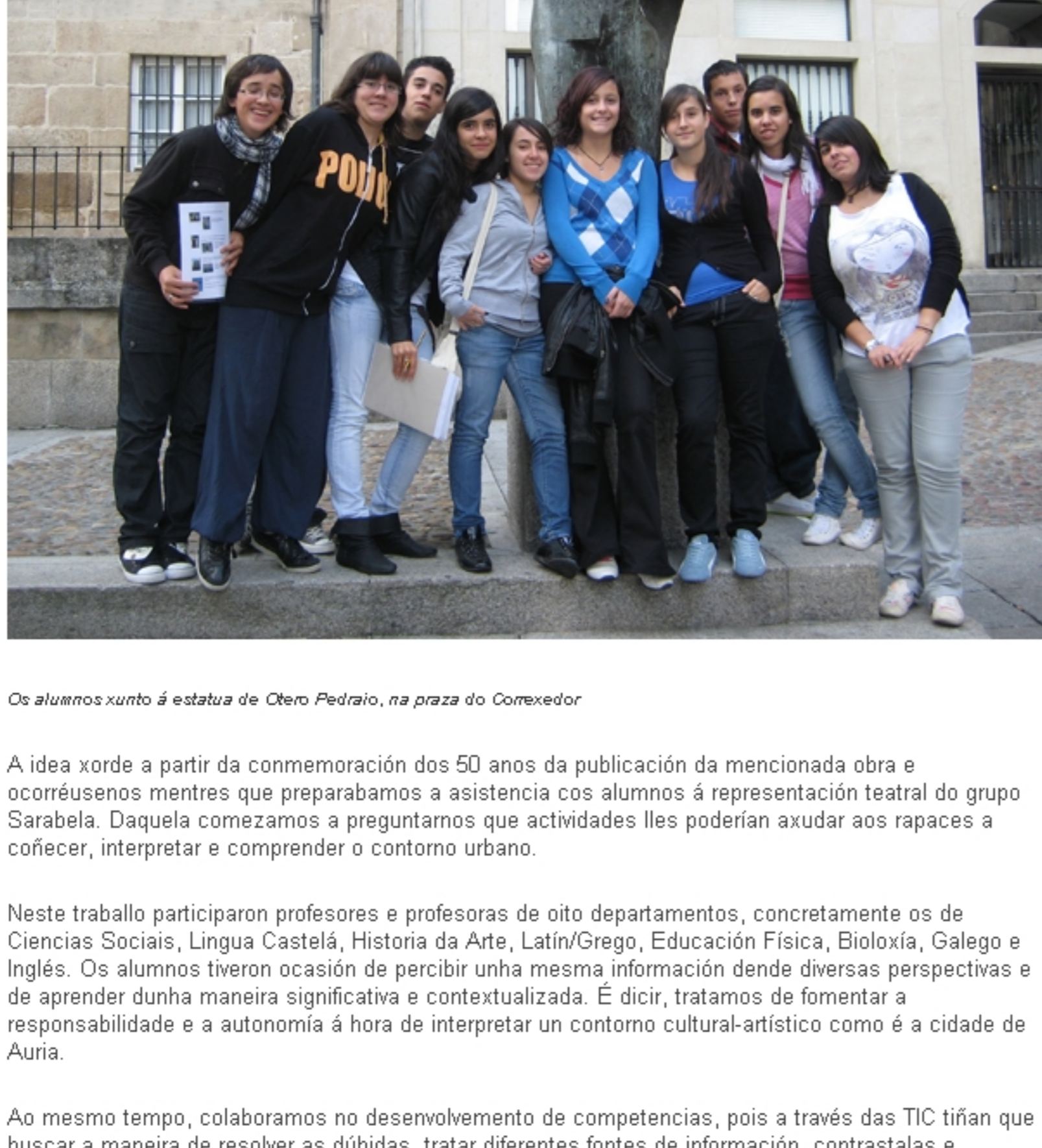
Os alumnos xunto á estatua de Otero Pedrayo, na praza do Concello

A espai-facilítase á cénica, cón afirmamos a alumnos de bacharelato. Partimos da liña argumental da novela de Eduardo Blanco Amor, A Esmorga, que se desenvolve en Ourense. A obra servímonos de pano de fondo para realizar un percorrido pola historia, a arte, a mitoloxía, a arquitectura e a literatura, que foron conformando o que foi a cidade, o que é a actualidade e o que somos nós hoxe en día. A participación de profesores de distintas áreas contribúe a darlle unha visión global e multidisciplinaria do tema, e serviu para aproveitar ao máximo as súas posibilidades formativas.