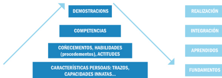
Gráfica 1: Xerarquía de resultados de aprendizaxe (NCES 1 , 2002)

A gráfica 1 mostra o nivel superior onde se sitúa a competencia. E por iso, as prácticas profesionais, as de laboratorio ou o practicum resultan espazos formativos axeitados para verificar a integración de saberes mencionada.