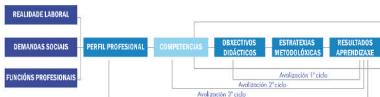
Gráfica 2: A avaliación de competencias a diferentes niveis

De acordo coa gráfica 2, a avaliación dos docentes de aula céntrase, sobre todo, en analizar a consecución dos obxectivos de aprendizaxe, e nalgúns casos, na verificación do desenvolvemento de competencias específicas ligadas á materia correspondente ou asignadas a ela. Sería máis propio da titulación, a avaliación das competencias do programa e da institución, verificar mediante estudos específicos de avaliación de impacto, ou a través dos observatorios de graduados, se o proceso formativo consegue os profesionais que demanda a realidade, e se os formados dan a resposta adecuada ás esixencias do ámbito.