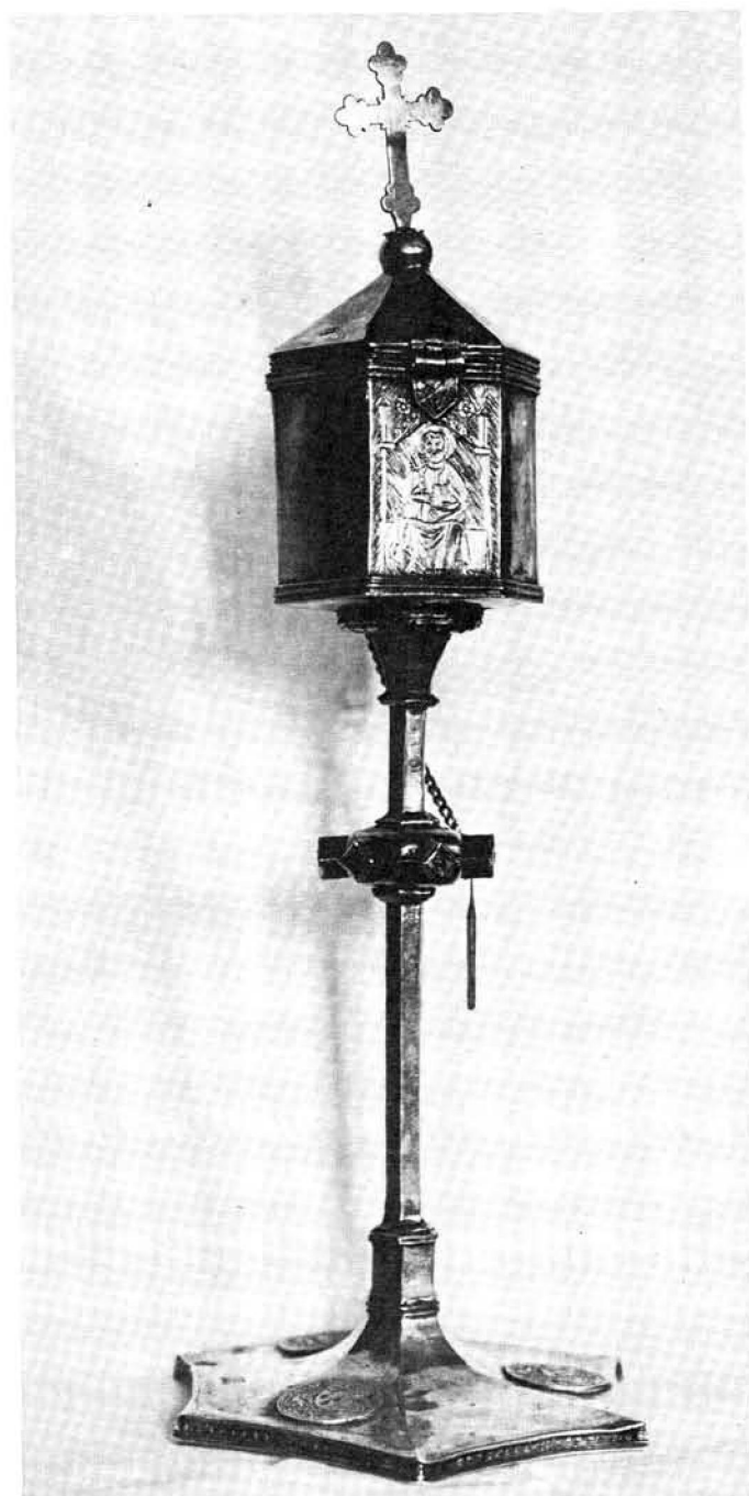
Fig. 1.— Portaviáticos de plata conservado en la parroquia de Algaida. Siglo. XV.