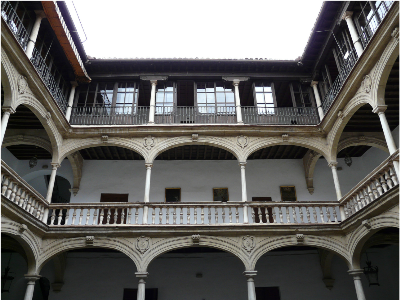
Patio del Colegio de San Bartolomé y Santiago, antigua casa de Bartolomé Veneroso

mármoles, de lápidas con bellos letreros, de ricos adornos... Sin embargo, todo lo anterior se adquiría mediante dinero, se conseguía simplemente pagando 28