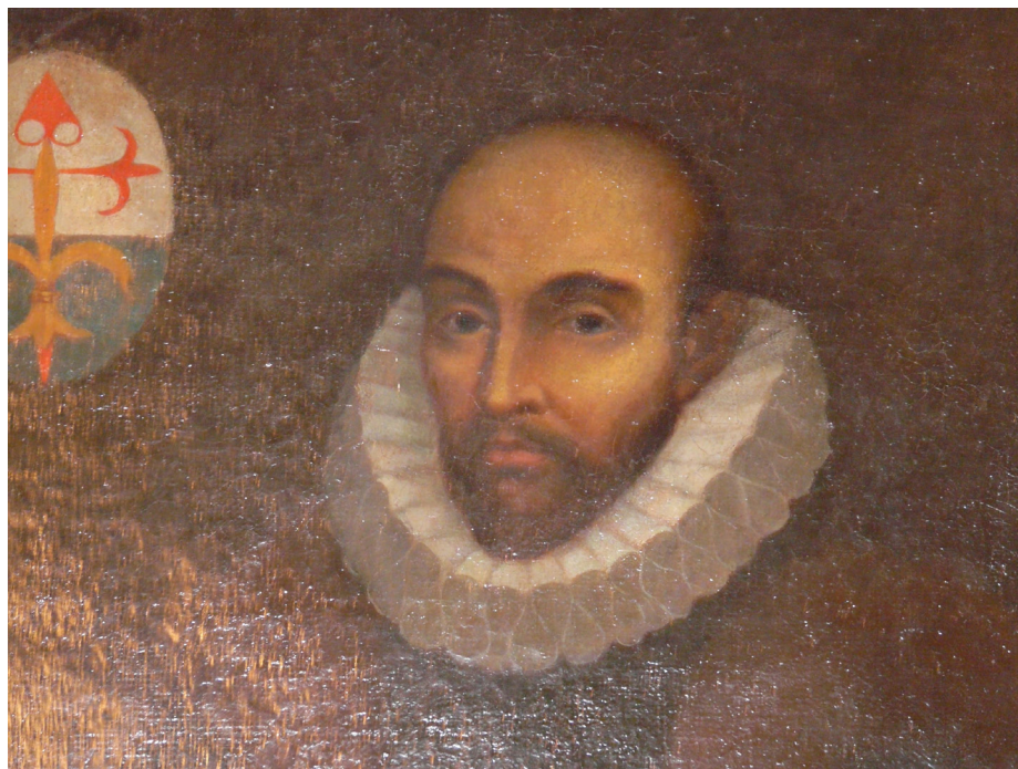
Retrato de Bartolomé Veneroso

Pero fueron Veneroso y una pequeña cantidad de sus compatriotas, aquellos tan afortunados como él, los que crearon en torno suyo la imagen del genovés en la Edad Moderna: mercaderes nobles, de grandes rentas, poderosos e integrados en la élite por matrimonios con mujeres castellanas; regidores y por tanto con posibilidad de ser procuradores a Cortes; grandes asentistas y títulos de Castilla. Un lobby ubicuo en la Corte y en casi todos los reinos peninsulares, pero especialmente en el que nos ocupa: el de Granada, casi una colonia genovesa, donde los mercaderes ligures monopolizaron –como en pocos territorios– el comercio ya desde época nazarí. Muchos argumentos aquí expuestos serán extrapolables a otros territorios de Castilla, en menor o mayor grado.