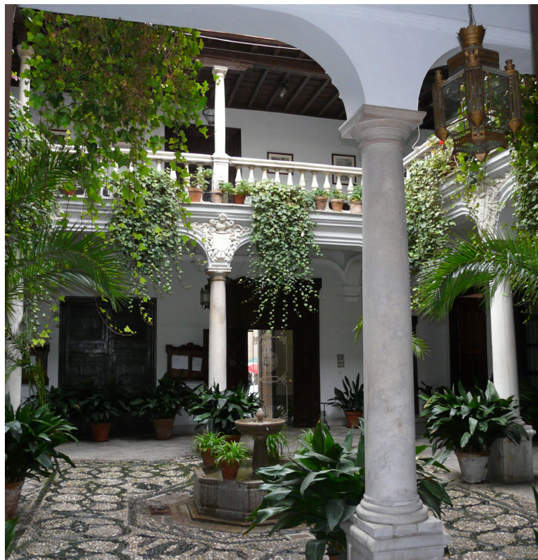
Palacio de los Franquis, hoy Archivo de Protocolos de Granada

En este año de 1639 estando en la villa de Madrid corte de nuestra España, don Juan Bartolomé de Beneroso Mendoza, le tiró un pistoletazo dentro de la iglesia del hospital de la corte y virgen del buen suceso a un caballero porque el tal se trataba de casar con doña aldonça de mendoça su madre, y fue dios servido por la intercesión de la soberana imagen del buen suceso de que no le mató, con que se tubo