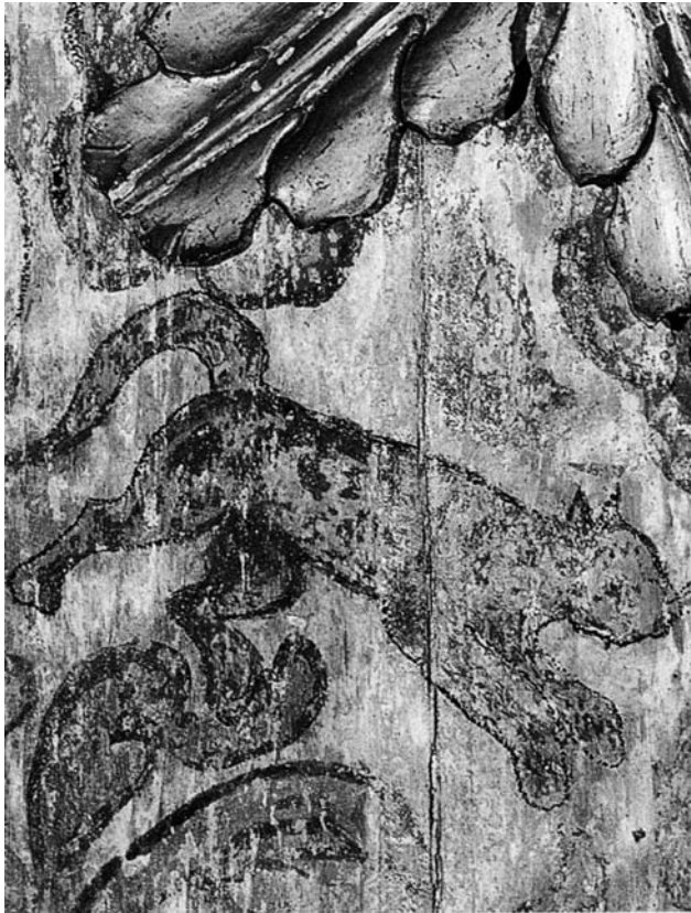
Pintura mural. Detalle con fauna de la región. CORO IGLESIA DE SANTA CLARA, BOGOTÁ

participar abiertamente en un “diálogo nacional” real [...]. De esta forma, los ciudadanos reescribirán, repensarán y reinterpretarán la historia y la transformarán a la luz de nuestros valores fundadores, los cuales son la democracia y la libertad [...] (Alta Consejería Presidencial para el Bicentenario de la Independencia) 8 .