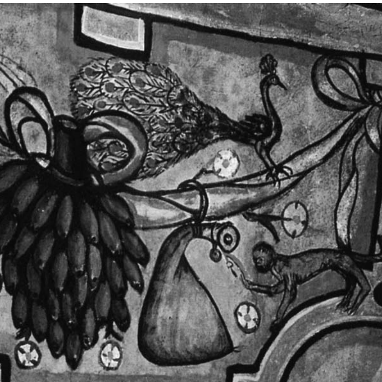
Pintura mural. Detalle de pintura alegórica con flora y fauna del trópico | CASA DE JUAN DE CASTELLANOS, TUNJA FOTOGRAFÍA LUIS CRUZ | EL SELLO EDITORIAL