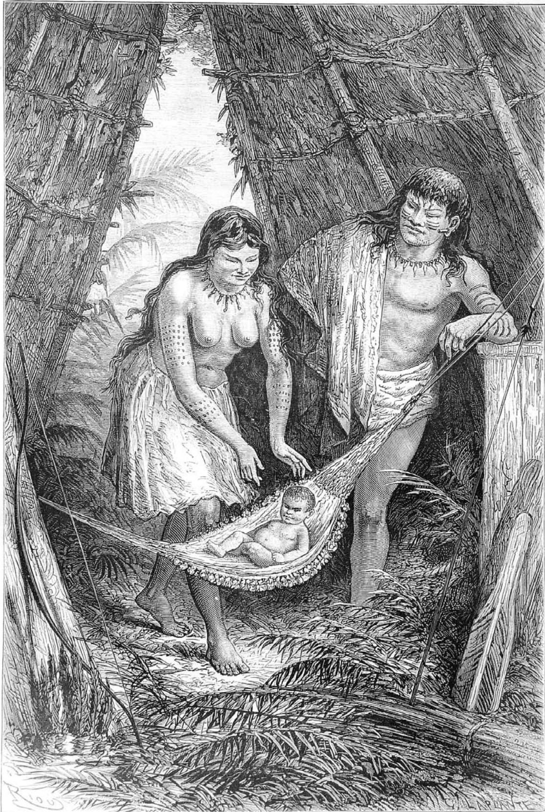
Pareja de indios churoyes y niño.

GRABADO | DIBUJO DE E. RIOU | ÉDOUARD ANDRÉ. L'AMÉRIQUE ÉQUINOXIALE . PARÍS, 1869