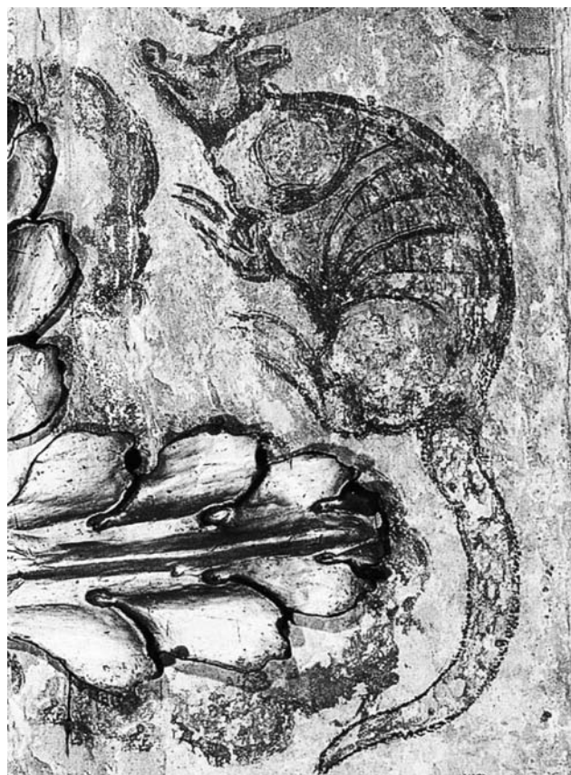
Pintura mural. Detalles con fauna de la región.

CORO IGLESIA DE SANTA CLARA, BOGOTÁ | FOTOGRAFÍAS MAURICIO OSORIO | EL SELLO EDITORIAL