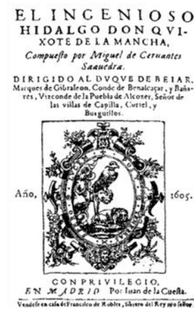
Gráfico nº 5: Portada de la obra completa