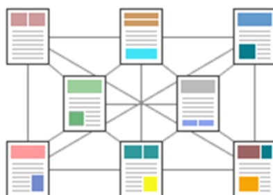
Gráfico nº 1: Estilo hipertexto