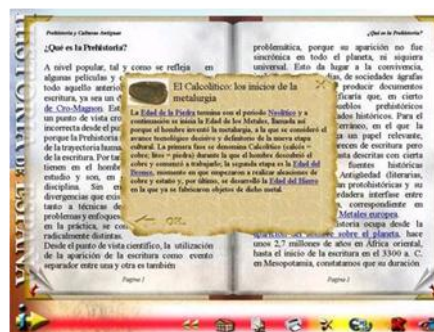
Gráfico n° 3: Representación de texto intercalado en otro texto mediante un vínculo