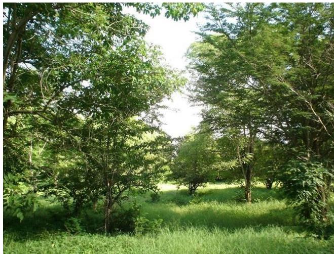
Figura 1. Potrero “perezoso”

En este trabajo se plantearon varios objetivos: primero analizar conceptos teóricos y prácticos que fundamentan el diseño de sistemas sostenibles de producción en el bosque seco Tropical (bs-T). Segundo, realizar un recorrido por un sistema productivo con modelo agroforestal, que permita señalar la importancia de combinar diferentes organismos vivos y que su interacción causa un impacto positivo tanto a nivel ecológico como económico. Tercero, fortalecer capacidades para la discusión y análisis de información respecto a alternativas sostenibles de producción en el trópico. Para lograrlo, se realizó el estudio de caso de un sistema de producción con enfoque agroecológico: un sistema silvopastoril ubicado en la vereda San Pedro Sapo, del municipio Santa Bárbara de Pinto, en la región Caribe colombiana.