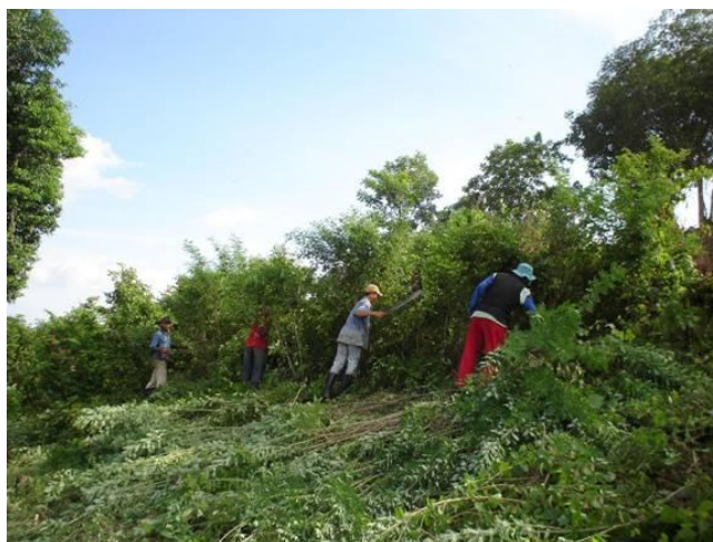
Figura 4. Desmote racional con machete

Indagando: ¿Qué árboles dejaron y porqué? Conceptúo: “totumo, guácimo porque son muy gustosos, aguantan el ramoneo y varios cortes al año, dan muchos frutos, poca sombra, permiten que el pasto crezca debajo de ellos y aguantan con la hoja una parte de la sequía, al campesino le gusta porque da leña buena, y con el fruto de totumo hacemos ensilaje y los trabajadores alimentan los cerdos y gallinas (Fig. 5), y las señoras elaboran utensilios de cocina. El campano, orejero, guacamayo, porque dan hojas, frutos que se recogen para alimentar el ganado en la época de sequía, y porque dan madera para postes, los dos primeros dan mucha sombra y son pocos los que se pueden tener por potrero, si la finca es pequeña no se pueden dejar crecer. El hobo, dividivi, aramo, trupillo, se dejaron inicialmente pero son los primeros que se van en la entresaca o corte porque las hojas no son tan gustosas y producen mucha semilla que se convierte en biomasa indeseable al germinar, dan buena leña; el primero es gustoso pero se traga el alambre en las cercas, crece mucho y el ganado no lo alcanza para comerlo. Hay muchas otras plantas y árboles que se han dejado porque en ese terreno no da nada más, y porque toleramos un poco el nivel de biomasa indeseable para disminuir costos de fumigación y porque las cabras y carneros se las comen, ellas son un control cultural”.