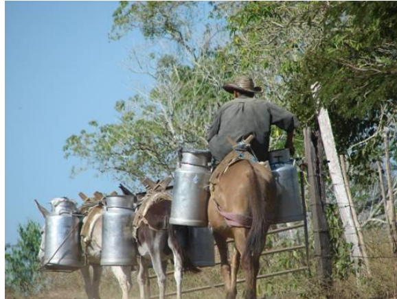
Figura 8. Transporte tradicional de la leche desde la finca hasta el lugar de comercialización