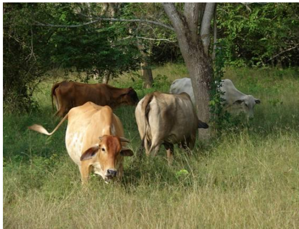
Figura 7. Silvopastoreo con ganado “siete razas”

Recabando en el tema se le interrogó: ¿Pero todas estas ventajas son para los dueños, los trabajadores como se benefician? Dijo: “De muchas maneras, primero generamos empleos bien remunerados con el manejo doble propósito que en otros modelos de ganadería, gracias al sistema silvopastoril que permite mejorar la dieta alimenticia de los animales y su confort posibilitando el ordeño de la vaca con ternero. Asimismo reciben leche para hacer queso y suero; sembramos peces en los jagüeyes que alimentamos con estiércol de los corrales y ellos los pescan para su consumo; tienen el patio para criar gallinas y unos pocos cerdos que alimentan con totumo y con calostro sobrante de las vacas y cabras, además los animales pueden escarbar y hozar todo el terreno para buscar comida. Tienen leña suficiente y de buena calidad, pueden ver algo de televisión porque los paneles solares que están instalados lo permiten. El ambiente es saludable, pues no usamos casi insumos químicos. Todo esto se refleja en la salud que presentan