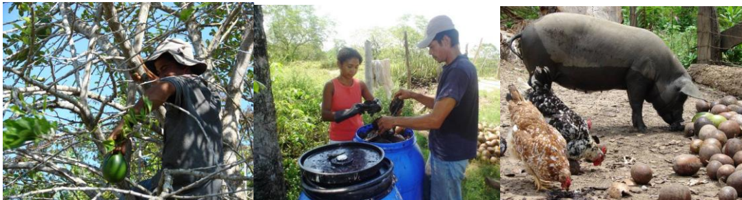
Figura 5. Los frutos del totumo y su consumo en fresco y ensilaje

porque se vuelve el refugio de insectos como el tábano (Díptera: Tabanidae) y mosquitos (Díptera: Culiciade) que molestan el ganado. Tenemos una regla para el manejo y es que el pasto necesita la mitad de la radiación que recibimos, entonces el resto queda para los árboles. Cuando nos pasamos del 50/50, debemos cortar los menos gustosos y que sirvan para leña o postes y reciclamos dando uso a todo”.