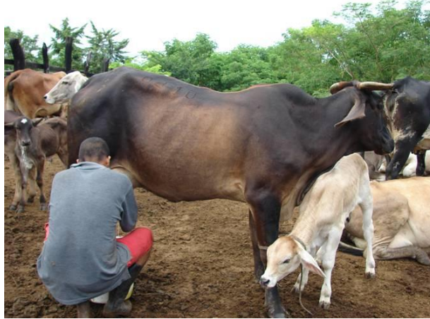
Figura 6. Condición corporal de vaca y ternero