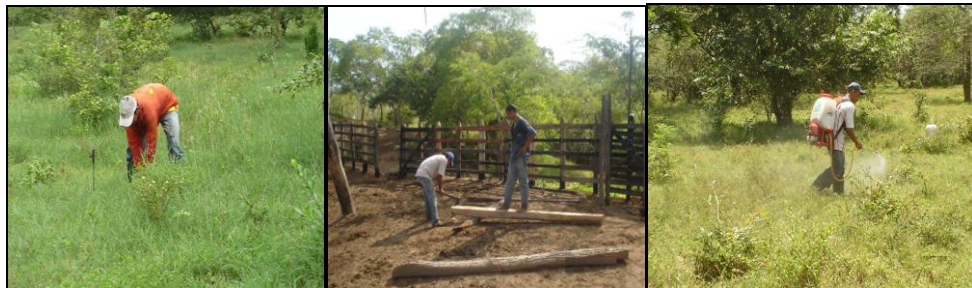
Figura 3. Interactuando con la naturaleza

Como infraestructura tiene una casa de habitación de bloques y techo de zinc, corrales en vareta para el ordeño del ganado y en guadua para los carneros y cabras; un patio en tierra cercado con alambre de púa donde crían cerdos y gallinas. La residencia no dispone de los servicios básicos domiciliarios, posee un sanitario con pozo séptico. Toda la finca está rodeada de cerca en alambre de púa y árboles como postes; las cercas internas (que dividen el área en 14 potreros) están en alambre eléctrico, alimentado a través de un sistema de varios paneles solares.