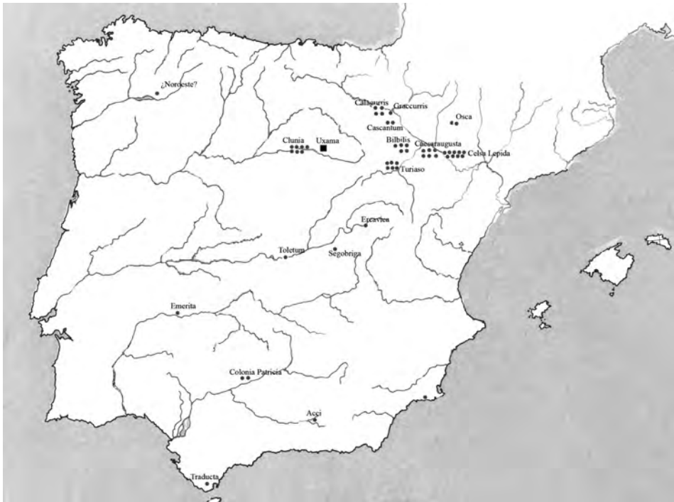
Fig. 9. Cecas hispano-romanas representadas en la muestra. Cada círculo representa una pieza.

bronces de este último y de Cómodo. En total, nueve piezas, de las cuales han podido ser identificadas con relativa seguridad los tipos de cinco (v. cuadro nº 1).