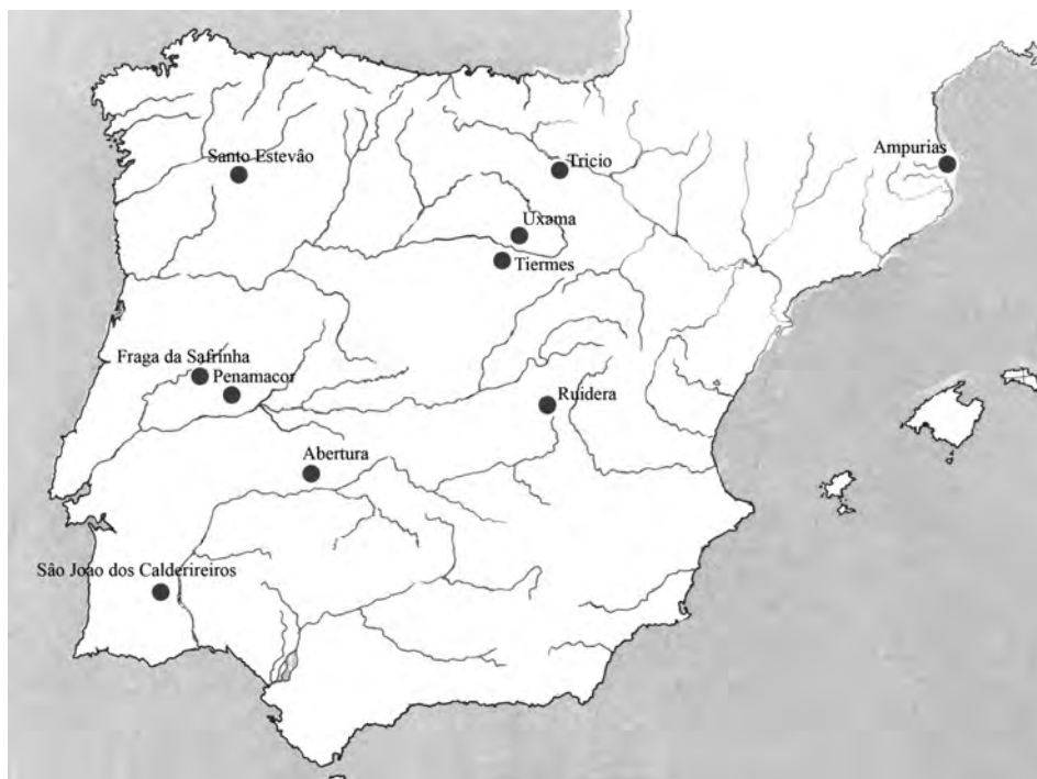
Fig. 6. Tesoros peninsulares de cronología augustea anteriores al 2 a.C.

desde finales del s. II hasta las emisiones augusteas acuñadas en Hispania alrededor del 19-18 a.C. Del tesoro de Penamacor, descubierto en 1948, se han publicado dos lotes de monedas, el primero formado por 10 denarios (Ramires, 1952) y el segundo por 76 (Guedes, 1955) aunque cabe la duda de que en este segundo figuren piezas del primero (Volk, 1997: 173, nº 51). Las monedas más modernas son augusteas fechadas entre los años 15-13 a.C. (RIC I 2 167 a, 171a y 173 a). Finalmente, el tesoro de S. João dos Caldeireiros tiene una fecha de cierre algo anterior, pues la moneda más moderna parece ser un denario de Emerita de c. 23 a.C. (Centeno, 1987: 212, nº 26; Volk, 1997: 171, nº 42). El resto de los 126 ejemplares estudiados, de los cerca de mil que fueron encontrados en 1958, se fehan desde mediados del siglo II.