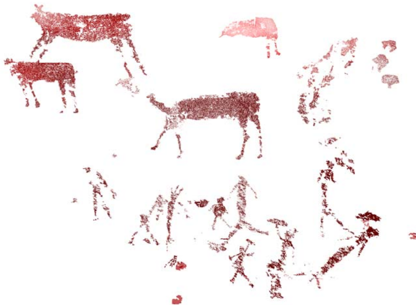
Figura 7. Escena entre figuras humanas y cérvidos en la que no se aprecian signos de violencia hacia ellos. Los Arenales, según Juan F. Ruiz (2006).

El gran problema de este tipo de relaciones es nuestro desconocimiento de la estructura sintáctica que emplearon los autores de este arte, ya que por lo general, la cercanía entre motivos no es un indicio suficiente para plantear su vinculación, ni lo es su simple coexistencia en un panel con independencia de la distancia entre ellos. Sin lugar a dudas es algo que debería investigarse en profundidad en el futuro.