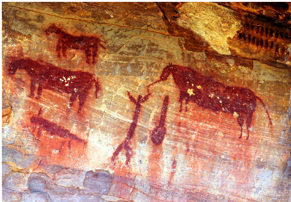
Figura 6. Escena entre un caballo y una figura humana. Selva Pascuala.

En otros casos se ha representado la monta por un jinete, pero como señalábamos en el párrafo anterior se trata de figuras que tienen poco que ver con el arte levantino clásico, o que incluso se podrían incluir en el arte esquemático. El más famoso es el jinete del Cingle de Gasulla (Ripoll, 1963), equipado con un yelmo con cimera, que probablemente corresponda a un añadido muy tardío con respecto al resto del abrigo. Otros ejemplos menos claros de equitación proceden del Abrigo de los Trepadores, del Abrigo de los Borriquitos (Almagro, 1956).