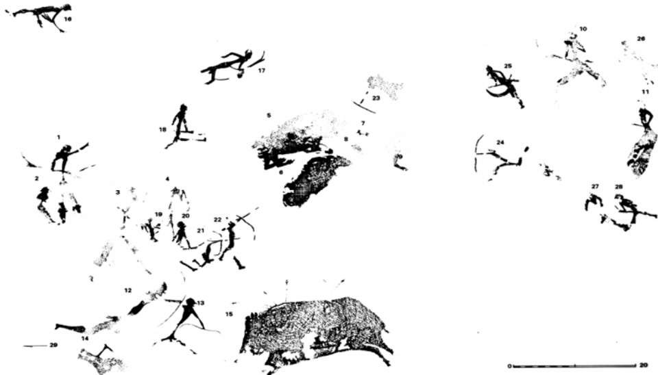
Figura 2. Escena acumulativa. Cingle de Palanques A, según Mesado, 1995. En esta escena al grupo original (figuras grises) se añadieron posteriormente nuevos arqueros (figuras negras) que complementaban a los iniciales.

La plasmación de las acciones cinegéticas es muy concienzuda. En diversos lugares del área levantina se detallan momentos distintos de la cacería, como el ojeo, el disparo, la persecución, el seguimiento de las huellas o marcas, y la captura de la pieza caída. La persecución se realiza en ciertas áreas levantinas por los arqueros lanzados a la carrera con las piernas abiertas en ángulo de casi 180° y en diagonal a las presas. Las escenas de Mas d'en Josep (Domingo et al, 2003), Cueva Remigia (Porcar et al, 1936) o Val del Charco de Agua Amarga (Beltrán, 2002), entre otros muchos lugares, ejemplifican esta temática.