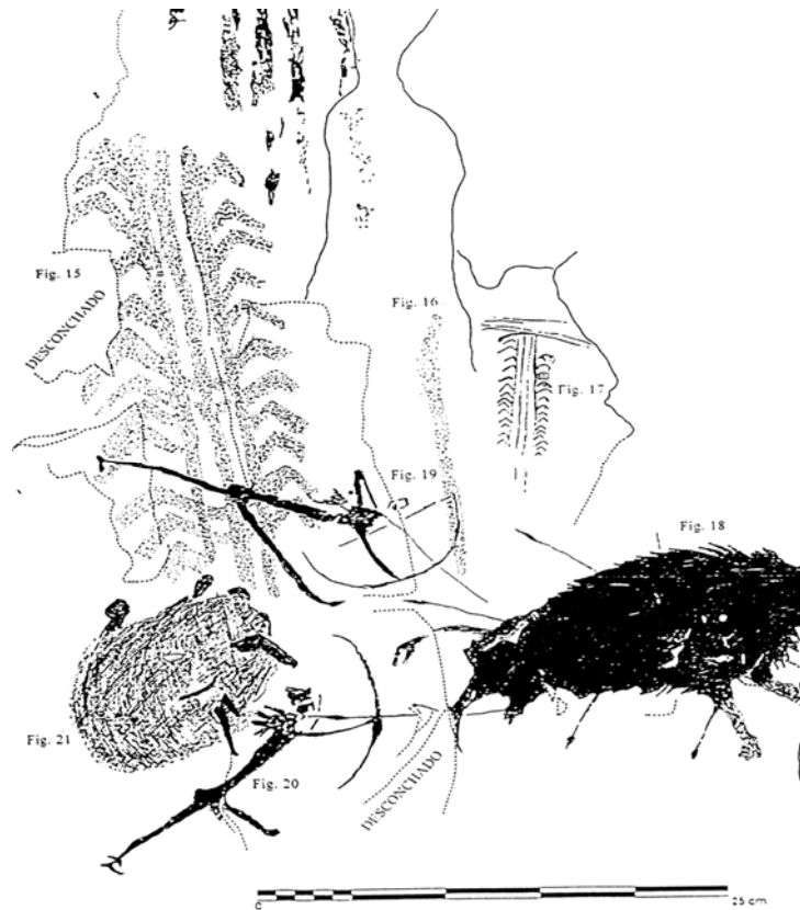
Figura 5. Escena de caza al acecho. Los Chaparros, según Beltrán (1998).

Las propias características de la especie venatoria determinan en gran medida la posición de los antropomorfos en las escenas, tal como hemos ya indicado para los jabalíes. Esta circunstancia se hace patente también en las figuras de cabras monteses, que en muchas ocasiones aparecen asaeteadas en el vientre y en la cara anterior de la garganta, es decir, disparando a las partes blandas de la pieza desde abajo, lo que quizás se deba a los propios hábitos de una especie de roquedo como ésta, y a su reacción ante el acoso.