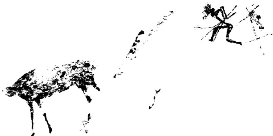
Figura 4. Escena de caza al rececho. Abrigo IX de La Saltadora, calco según López-Montalvo en Martínez (dir.) 2005: 273.