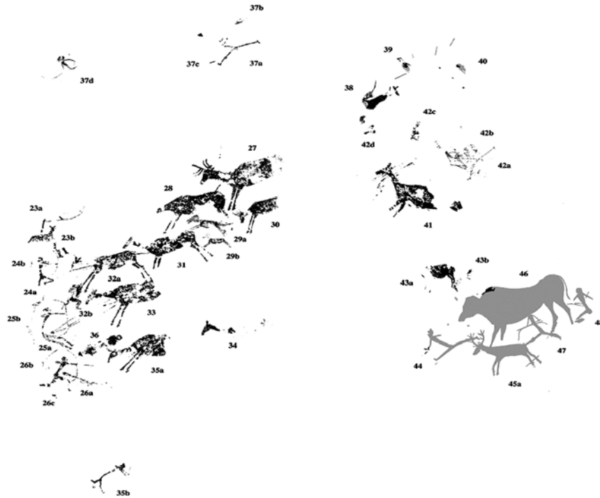
Figura 3. Escena de caza por ojeo. Cova dels Cavalls, calco según Domingo y López-Montalvo, en Martínez y Villaverde, 2002.

haber emprendido la huida; Los Chaparros (Beltrán, 1998), Cueva Remigia o Peña del Escrito II (Ruiz, 2005) podrían ser buenos ejemplos de estos jabalíes con flechas clavadas en sus cuartos traseros.