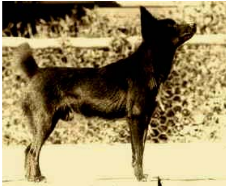
Figura 3. El perro Tahltan Bear

color blanco y negro, tenía el tamaño de un zorro (de 12 a 15 pulgadas a la cruz) (Crisp, 1956; Wilcox y Walkowicz, 1989).