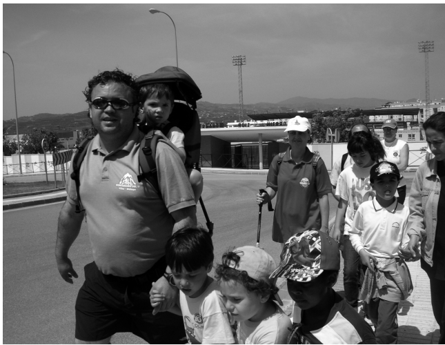
Tercera Marcha Verde, octubre 2009

Asumir que es un proyecto de todos y para todas las edades.