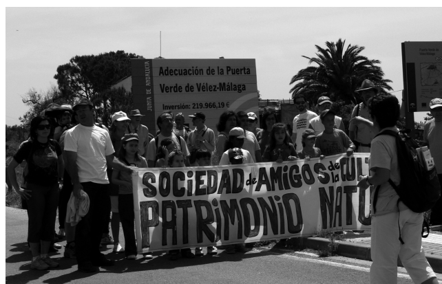
Tercera Marcha Verde, octubre 2009

hay razones poderosas para luchar por él y que son: