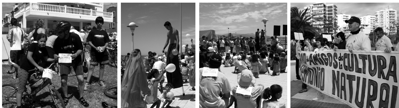
Primera marcha verde, diciembre 2008

Tras una concentración en las proximidades de la antigua estación del ferrocarril de Vélez-Málaga, los manifestantes iniciaron la marcha exhibiendo pancartas reivindicativas sobre la creación de la red de Caminos Verdes en la Axarquía. Aunque el trayecto estaba pensado realizarse por la margen izquierda del río Vélez, uno de los caminos verdes previstos en el proyecto, los manifestantes no pudieron iniciarlo en el Camino de Remanentes, debido a que un propietario ha cerrado el camino de servidumbre (obligatorio por la Ley de Aguas) mediante una valla metálica. Este hecho obligó a iniciar la marcha desde el Camino Viejo de Málaga, pasando debajo del viaducto de la autovía y prosiguiendo en dirección sur hasta llegar a la desembocadura, donde tomaron un aperitivo organizado por miembros de la SAC.