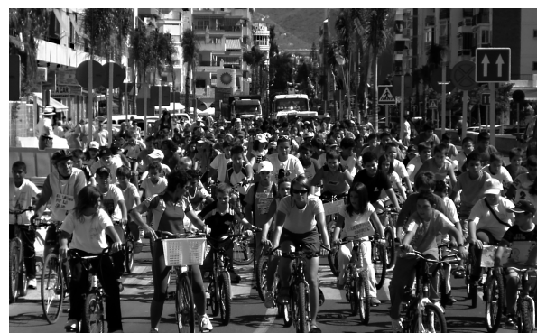
Actividades de concienciación de la población escolar: La Semana de la Bici y El Día del Pedal

caballo, o en bici) en zonas amplias, cómodas, seguras y accesibles.