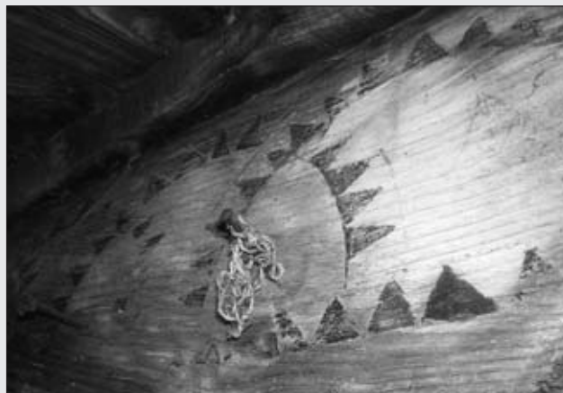
HÓRREO DE CASA FAUSTA. PREMOÑO. FOTO CARLOS X. VARELA AENLLE

Presentaba decorados los liños norte y este, además de algunos motivos en las colondras del segundo. El liño este situado encima de la puerta constaba de arcos ojivales y de medio punto entrelazados con líneas rojas y picos negros, constando además con la par-