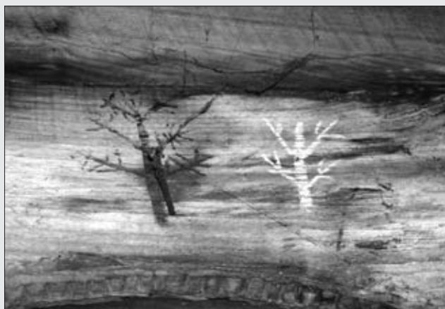
HÓRREO DE CASA FAUSTA. PREMOÑO

Posee un conjunto decorativo pintado en los liños con motivos policromados en color negro y blanco