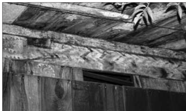
EL ESPOLÓN. CASA WEBER. FOTO FRANCISCO X. FERNÁNDEZ RIESTRA

Hórreo sobre cuatro pegollos, situado en desnivel lo que da lugar a que se asiente sobre una estructura