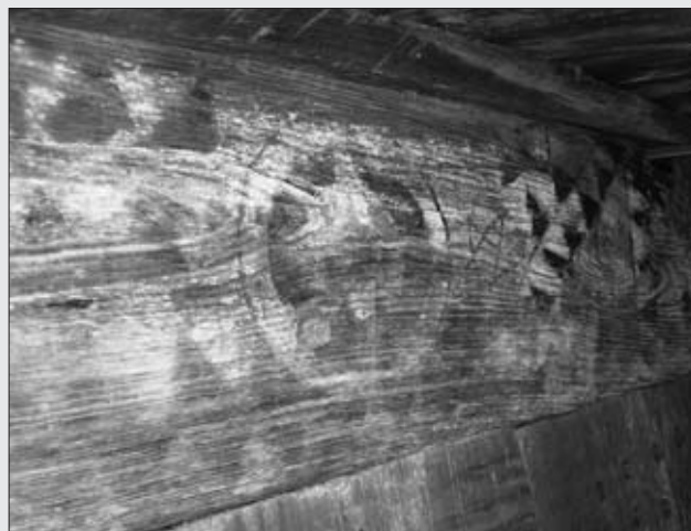
HÓRREO DE CA SANCHO. PREMOÑO.

Presenta uno de los mejores conjuntos decorativos del concejo, con gran variedad de motivos tanto