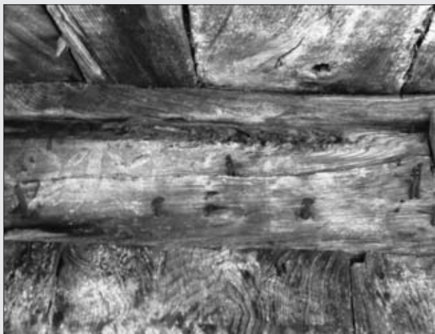
PANERA EN ANDAYÓN.

rior. En las colondras se pueden observar todavía líneas horizontales con triángulos y una roseta inscrita en un círculo con restos de otros motivos figurativos.