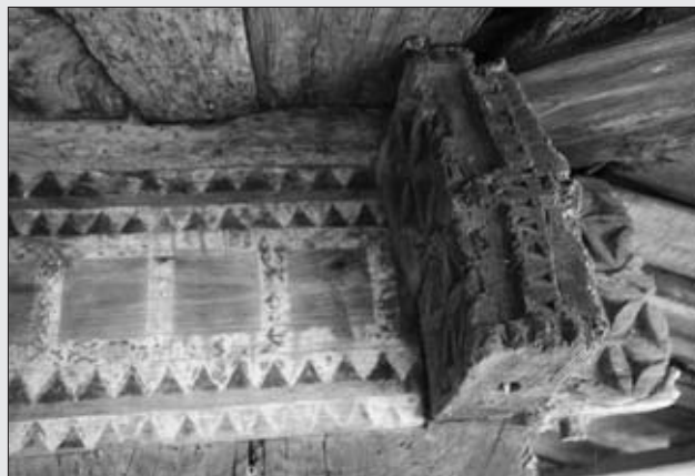
HÓRREO EN CARRIL.