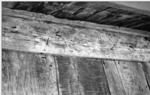
HÓRREO EN LLANDRÍO.

La estructura de la cámara es evidentemente anterior y muestra un carácter arcaico donde destacan los liños con pinturas ya muy desgastadas, pero donde se