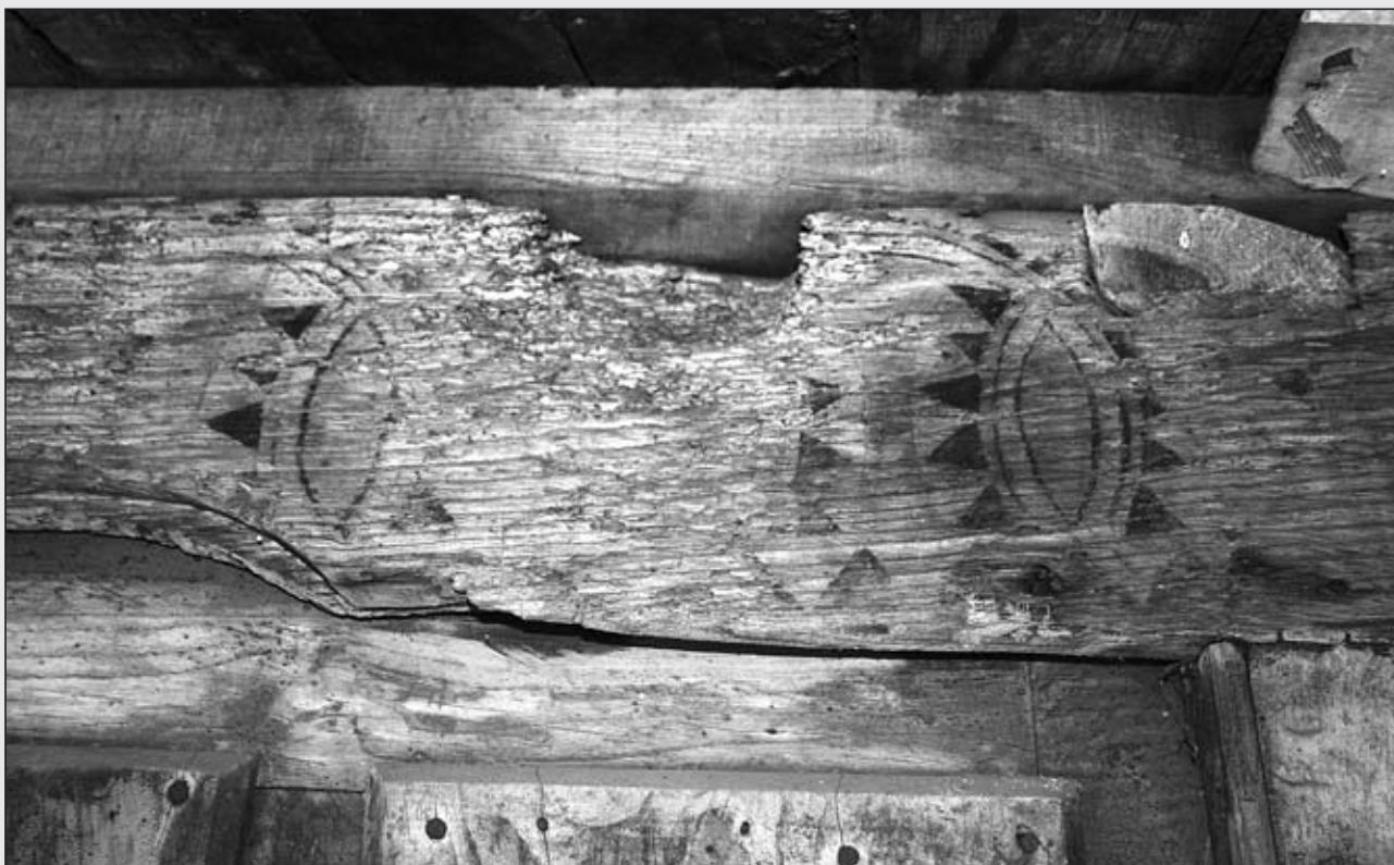
HÓRREO EN VALSERA. FOTO FRANCISCO X. FERNÁNDEZ RIESTRA

Presenta decoración pintada en liños y colondras mal conservada, formada por líneas de triángulos negros y casetones con rosetas tetrapétales en su inte-