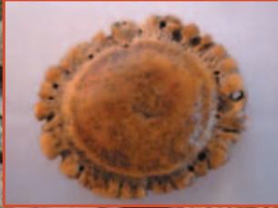
Pachu'l Cantu, un arquetipo de sabiduría popular