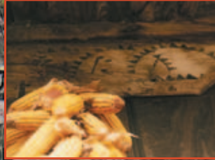
Los hórreos con decoración pintada en el concejo de Les Regueres