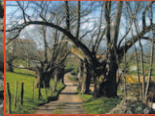
Premoño en 1752