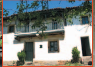
Vaqueros de la Casa Pericón de Tuernes, Llanera