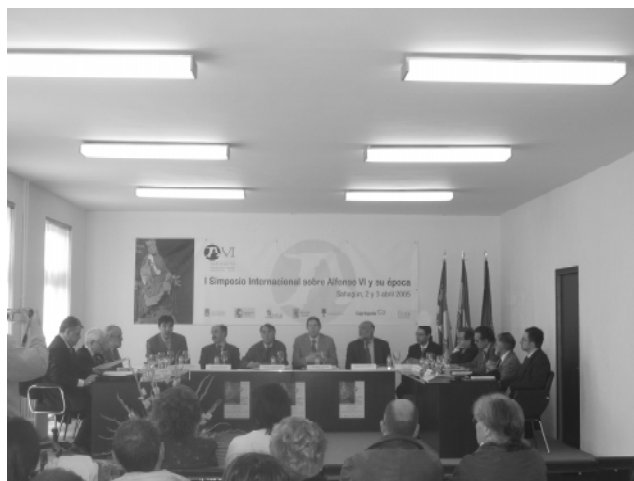
Presentación pública de la Comisión Organizadora del IX Centenario de Alfonso VI en Sahagún (2005)

La labor de investigación ha seguido dos líneas principales. La primera, centrada en el conocimiento de la figura alfonsina y la historia, arquitectura, urbanismo y medio del monasterio y villa. Su ámbito se ha diversificado en varios niveles, que alcanzan el plano internacional. Así, se ha propiciado la entrada de Sahagún en la Fédération des Sites Cluniens , que, además de conllevar su inclusión en la Red de Sitios Clunienses (Gran Itinerario Cultural del Consejo de Europa), ha permitido acordar un protocolo de celebración conjunta en Europa para los centenarios de Alfonso VI (2009) y Cluny (2010). Este interés por la superestructura cultural cluniense, que ha experimentado un fulgurante auge en toda Europa los últimos años, no es sino una emulación de la propia política alfonsina, y en la misma línea se han celebrado diferentes encuentros con el IPPAR y la Dirección Regional Cultura del Norte (Ministerio de Cultura de Portugal), que permitirán desarrollar proyectos conjuntos sobre investigación y gestión del Patrimonio.