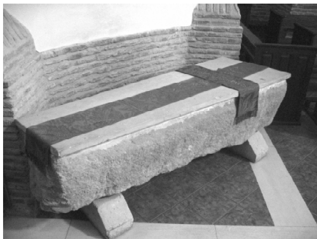
Enterramiento de Alfonso VI en la iglesia de las MMBB de Sahagún