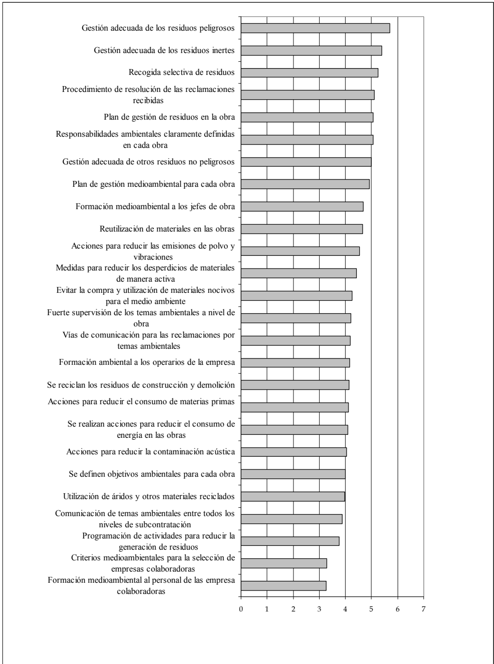
Figura 4. Implantación de prácticas medioambientales a nivel de obra